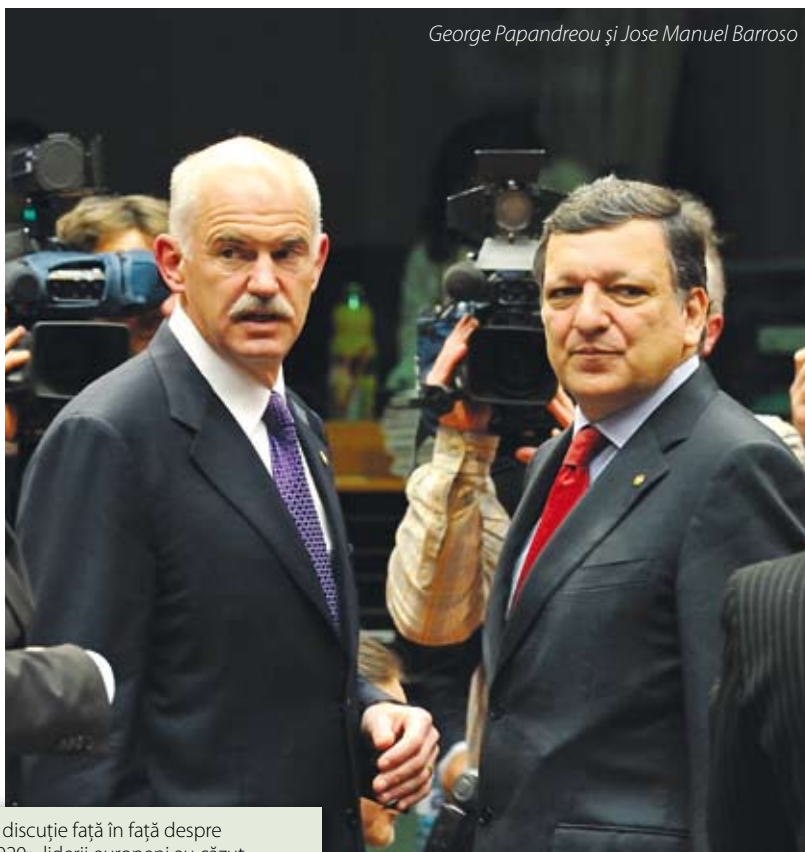
George Papandreu și Jose Manuel Barroso

La prima lor discuție față în față despre «Strategia 2020», liderii europeni au căzut de acord asupra unora dintre punctele din document, în timp ce la altele au stabilit că trebuie reanalizate. Pentru că Uniunea Europeană se pregătește de deceniul următor, Comisia Europeană a lansat, la începutul lunii martie, mult-așteptata «Strategie 2020» – conținând planuri ambițioase de creștere economică și crearea de locuri de muncă. «Europa 2020» înlocuiește strategia Lisabona, care nu a reușit să-și atingă obiectivul – acela de a face din Uniunea Europeană, până în 2010, cea mai dinamică economie bazată pe cunoaștere din lume.