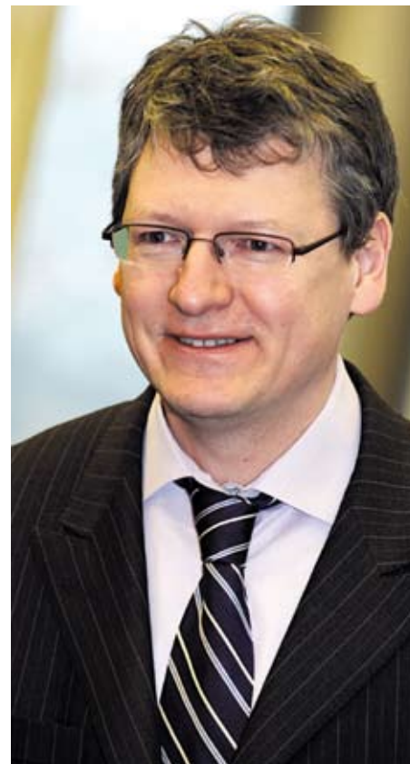
László Andor – Comisarul UE pentru Ocuparea Forței de Muncă, Afaceri Sociale și Incluziune

Dacă banii din acest instrument de finanțare s-ar alocă pentru fiecare țară în parte, atunci Ro-