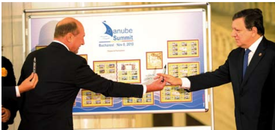
Jose Manuel Barroso și Traian Băsescu

Pentru a accesa varianta completă a acestei broșuri, puteți folosi adresa de internet http://europa.eu/abc/12lessons . ■ (M.O.)