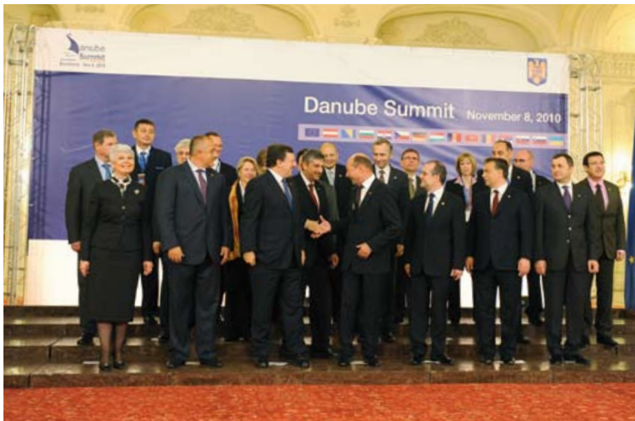
Jose Manuel Barroso, Traian Băsescu și Emil Boc la Palatul Parlamentului

Summit-ul Dunării a reunit în luna noiembrie, la București, 22 de delegații reprezentând guvernele din cele 14 state din bazinul Dunării, Comisia Europeană, cele șase landuri riverane din Germania și Austria, primăria orașului Ulm din Germania, precum și Polonia în calitate de observator. În cadrul evenimentului au fost dezbătute obiectivele prioritare în procesul de structurare a Strategiei UE pentru Regiunea Dunării, iar la final participanții au semnat o declarație comună.