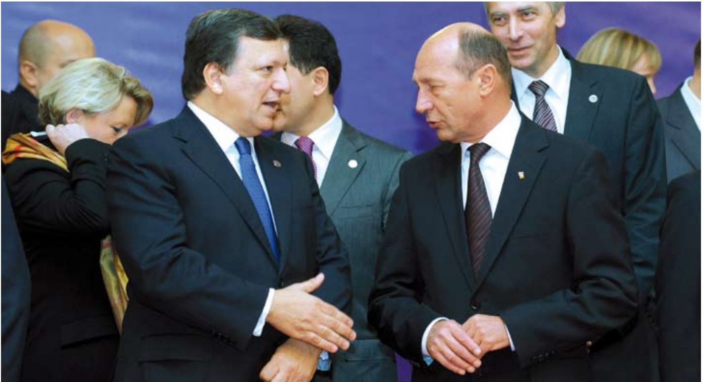
Jose Manuel Barroso și Traian Băsescu