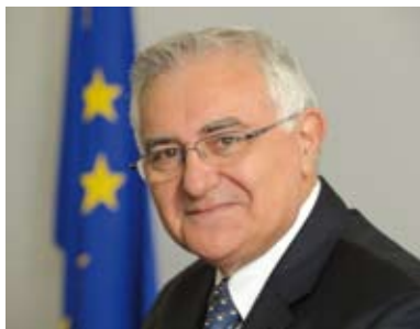
Comisarul european pentru Sănătate și Protecția Consumatorilor, John Dalli