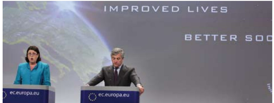
Doamna Maire Geoghegan-Quinn, comisar european pentru Cercetare, Inovare și Știință și domnul Antonio Tajani, comisar european pentru Industrie și Antreprenoriat

Comisia Europeană (CE) a lansat proiectul intitulat „Uniunea inovării”. Inițiativa prioritară vizează concentrarea eforturilor Europei asupra unor provocări precum schimbările climatice, energia și resursele limitate sau îmbătrânirea populației.