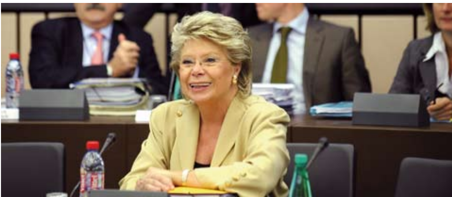
Viviane Reding, comisarul european pentru Justiție, Drepturi Fundamentale și Cetățenie

Comisia Europeană a renunțat la procedura de încălcare a legislației comunitare vizând Franța, anunțată după evenimentele legate de expulzarea romilor. Guvernul de la Paris s-a conformat solicitărilor venite de la Bruxelles și, la termenul solicitat (15 octombrie), a trimis un plan de măsuri concrete pentru transpunerea în dreptul național a Directivei 38 privind libera circulație a cetățenilor comunitari. Un plan de măsuri însoțit de un calendar amănunțit al etapelor legislative – așa cum ceruse Bruxellesul. Ca urmare a angajamentelor oficiale, luate de Franța, pentru moment, Comisia Europeană nu va declanșa procedura de încălcare a legislației comunitare, decisă de colegiul comisarilor la 29