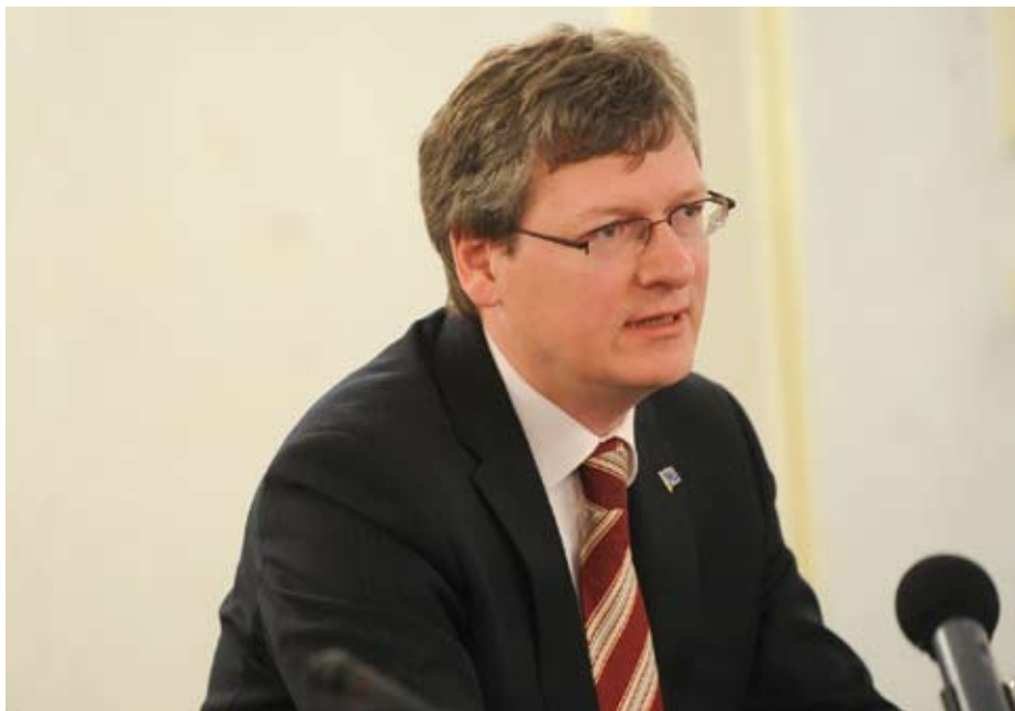
László Andor, comisarul european pentru Ocuparea Forței de Muncă, Afaceri Sociale și Incluziune

În perioada 12-13 octombrie 2010 a avut loc la București reuniunea la nivel înalt privind «Contribuția fondurilor europene la integrarea populației roma», eveniment organizat de Comisia Europeană. Obiectivele reuniunii au fost informarea asupra oportunităților oferite de fondurile europene pentru incluziunea socială a romilor și identificarea modalităților de îmbunătățire a utilizării lor pentru a crește impactul proiectelor finanțate de către acestea. Evenimentul a reunit reprezentanți ai Uniunii Europene, ai autorităților publice de la nivel național, regional și local, precum și ai societății civile. În ultimii ani, Uniunea Europeană a elaborat un vast program de sprijinire a acestei minorități, însă, cu toate acestea, state membre, cum ar fi România și Bulgaria, nu au atras suficiente fonduri din portofoliul comunitar.