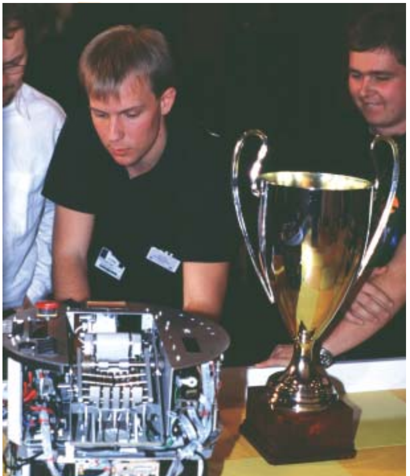
Ein Mitglied des Schweizer ID-Teams (links) mit ihrem zweitplatzierten Roboter unterhält sich mit Konkurrenten aus Deutschland (Mitte) und der Tschechischen Republik (rechts).