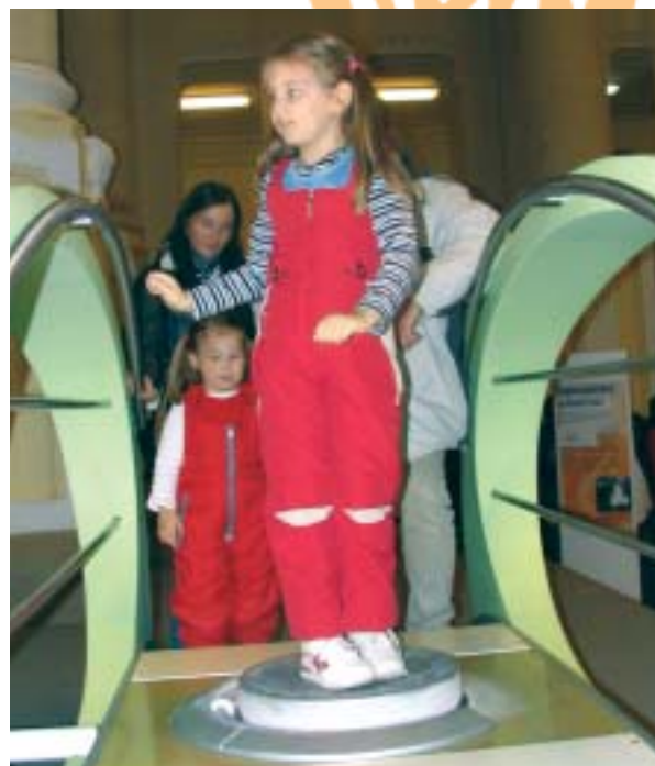
Ein junger Ungar lässt sich im „schwebenden Raum“ treiben.