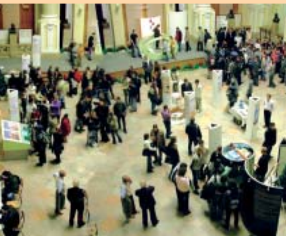
Über 2.000 Studierende pro Tag besuchten die Ausstellung „Zauberattraktion“ in Budapest.

Weitere beliebte Beispiele für den „Maglev“-Effekt waren das Supraleiter-Schachbrett, auf dem mit frei schwebenden Figuren gespielt werden konnte,