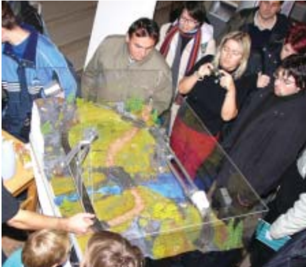
Eine Modellschwebbahn rast auf ihrer Magnetschiene, scheinbar ohne jemals an Geschwindigkeit zu verlieren.

n, Israel, Spanien, Schweden, Vereinigtes Königreich