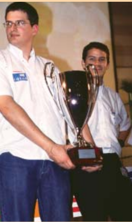
Das französische Supaero-Team holt den Eurobot Cup 2004.

Ein paneuropäischer Wettbewerb mit Hightech-Elektronik, wissenschaftlicher Problemlösung, inspirierender Teamarbeit, Kokosnüssen aus rotem Schaum und einer Menge Spaß und Aufregung – was könnte sich besser für die Wissenschaftswoche eignen? Eurobot ist der Europacup für Roboter und gewinnt Jahr für Jahr an Popularität und Reichweite. Aus ganz Europa und darüber hinaus kämpfen Teams von Studierenden, um zu testen, wer die besten Roboter baut!