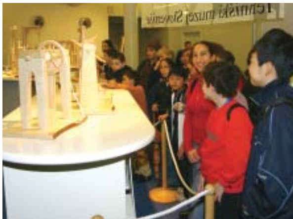
Kinder bei Ballistikvorführungen anlässlich der Ausstellung „Jurij Georg Vega, Artillerie und Logarithmen“ des Technischen Museums von Slowenien in Ljubljana.