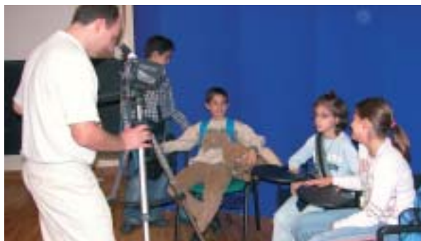
Schüler drehen einen Film im Klassenzimmer von morgen.

Das beliebteste dieser Projekte beinhaltete das Labor der Zukunft, mit dem versucht wurde, „Leben ins Klassenzimmer zu bringen“, indem die Schüler selbst physikalische Experimente durch den Einsatz eines sensorgesteuerten Fußballs und entsprechender Ausrüstung durchführen konnten. Bei einem weiteren Projekt, Eudoxos, erhielten jugendliche Schüler durch ein ferngesteuertes Roboterteleskop Unterricht in Wissenschaft und Astronomie. Währenddessen konnten Schüler mithilfe von Web-TV in Eigenregie Produktionen entwickeln und sie per Internet an andere Schulen in ganz Europa senden.