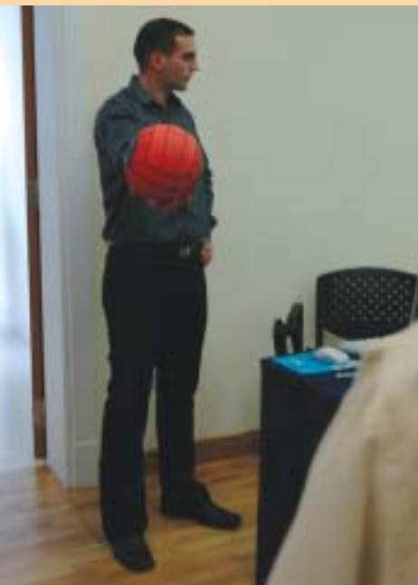
Dieser mit Sensoren ausgerüstete Ball bringt etwas Leben in die Klassenzimmerexperimente.