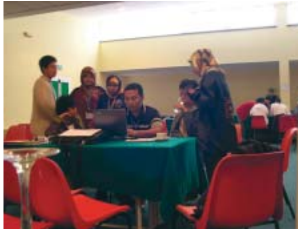
Während der ASEOTOPE-Veranstaltung untersuchten Schulteams aus Asien und Europa das WESPA-Portal.