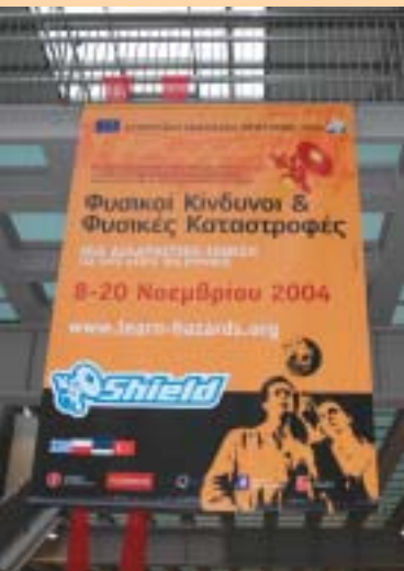
Einen Schutzschild gegen Naturkatastrophen errichten.

Auf der Ausstellung wurden einige der wichtigsten Arten von Naturkatastrophen gezeigt: Erdbeben, Vulkane, Überschwemmungen, Waldbrände,