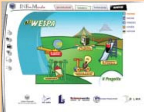
Das WESPA-Portal ist in mehrere Sprachen übersetzt.