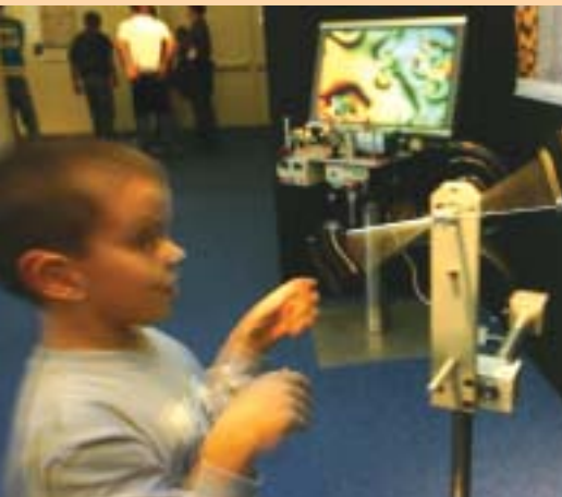
Ein kleiner Junge gewinnt aus erster Hand Einblicke in die Bewegungsdynamik auf der Ausstellung „Von Archimedes bis Poincaré, eine multimediale Reise in die Dynamik“, veranstaltet vom Institut Non Linéaire in Nizza, Frankreich.

Kommunikation war ein wichtiges Thema, was in einem zweitägigen Workshop zum Ausdruck kam, bevor das Festival unter dem Motto „Wissenschaftskommunikation in europäischen Wissenschaftszentren und Museen“ (SC-ESC&SM) mit Schwerpunkt auf der Ausbildung für Wissenschaftskommunikatoren eröffnet wurde. Während des Festivals führten 600 junge Helfer das Publikum durch die Exponate. Eines der langfristigen Ziele der Veranstalter ist die Errichtung einer neuen Schule, in der Wissenschaftsanimatoren in der Vermittlung und Darstellung komplexer Ideen geschult werden. In Europa gibt es bereits Ausbildungseinrichtungen für Wissenschaftsredakteure, aber die Begleiter durch die Ausstellungen benötigen nach