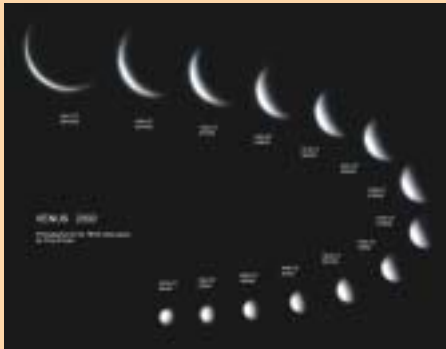
Die Phasen der Venus ähneln denen des Mondes, da sie die Sonne in einer Umlaufbahn innerhalb derer der Erde umkreist. Aufgrund der variierenden Entfernung von der Erde verändert sich auch die scheinbare Größe der Venus. Fotosequenz der Venusphasen, von der Erde aus beobachtet.

Die Veranstalter des weltweiten Venus-Transit-Programms 2004, das ebenfalls im Rahmen der Feierlichkeiten der Europäischen Wissenschaftswoche stattfand, dachten wahrscheinlich, dass nach dem riesigen Erfolg ihrer Aktion für Weltraumbeobachtung während des Sommers alle ihre Wünsche in Erfüllung gingen.