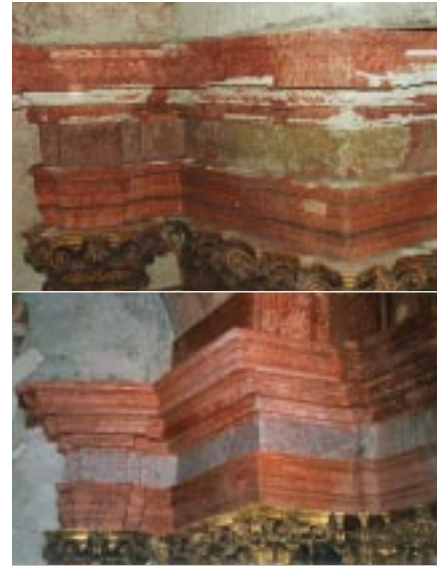
La chapelle des Ducs, à Krzeszów, avant et après les travaux de restauration. Telç: le centre d'excellence ARCCHIP dispose d'unités de recherche dans cette ville, classée "Patrimoine mondial" par l'Unesco, ainsi qu'à Prague.