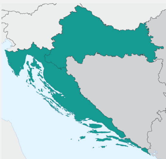
Kategorije regija za EFRR, ESF i EPFRR za razdoblje 2014. – 2020. ■ Slabije razvijene regije (BDP po glavi stanovnika < 75 % prosjeka za EU-27)

S proračunom od 454 milijarde EUR za razdoblje 2014. – 2020. Europski strukturni i investicijski fondovi (ESI fondovi) glavni su alat Europske unije za investicijsku politiku. ESI fondovi obuhvaćaju pet fondova: Europski fond za regionalni razvoj (EFRR), Europski socijalni fond (ESF); Kohezijski fond (KF), Europski poljoprivredni fond za ruralni razvoj (EPFRR) i Europski fond za pomorstvo i ribarstvo (EFPR). Hrvatska, zajedno s 19 drugih zemalja članica, imat će koristi od Inicijative za zapošljavanje mladih (YEI).