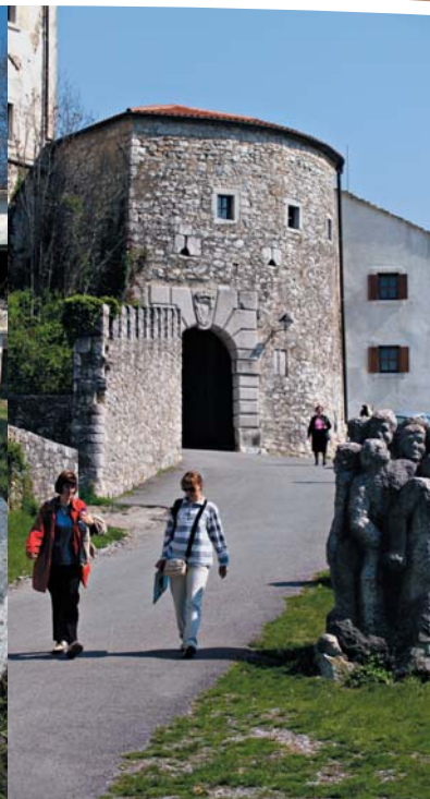
S pomočjo sredstev EU je bil obnovljen del ruševine gradu Štanjel, ki sedaj služi kot informacijsko središče