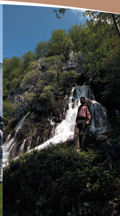
Gora predstavlja glavno vodno zajetje pitne vode za naselja na Trnovsko-Banjski planoti