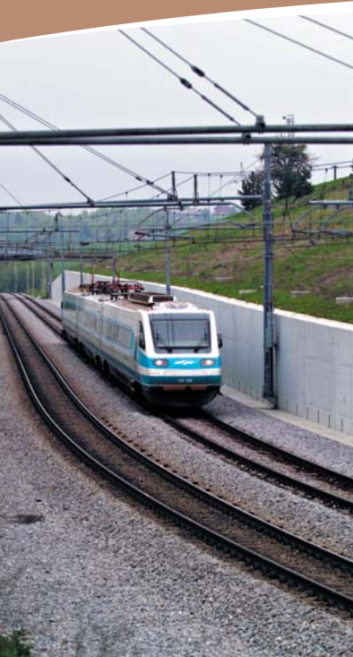
Prenova železniških tirov in ureditev useka pri Križnem vrhu na progi Ljubljana-Maribor