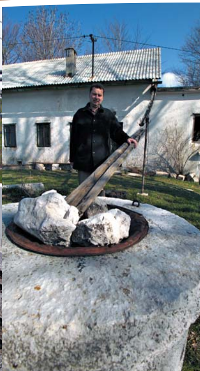
Projekt oskrbe s pitno vodo v naseljih Trnovsko-Banjske planote (področje Gora)