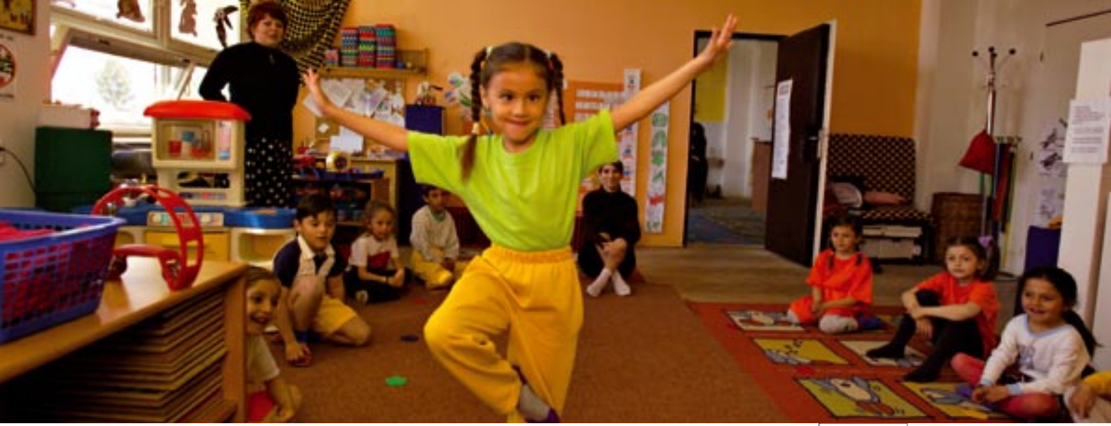
İnsana yatırım: Roma anaokulunda yeni çocuk bakım merkezi, Slovakya