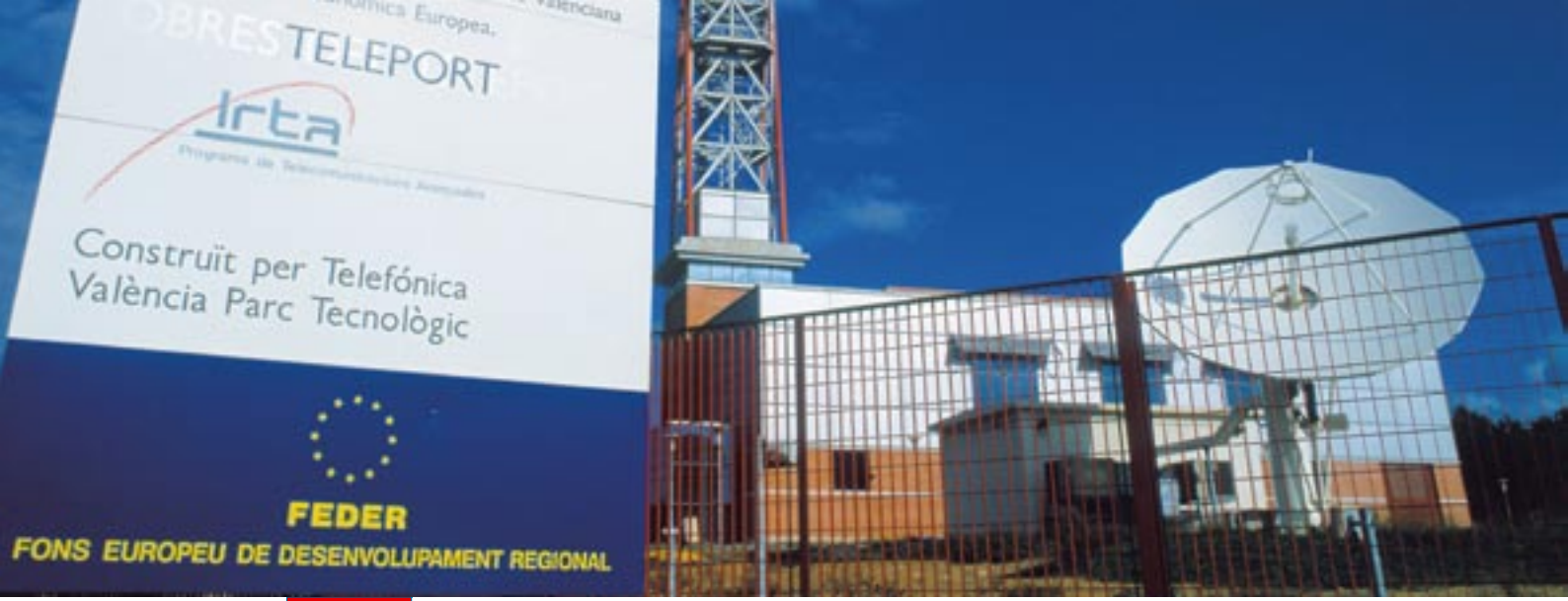
Valencia, İspanya'da telekomünikasyon parkı