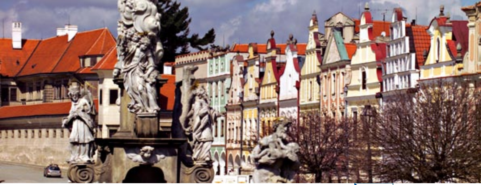
Telc, Çek Cumhuriyeti'nde bulunan eski şehir merkezi bir turist çekim merkezidir

Ulusal ve bölgesel idareler program yönetimi için yerel idareleri tamamen veya kısmen yetkilendirebilirken, diğer özel örgütler de ortak olarak sürece dahil edilmelidir.