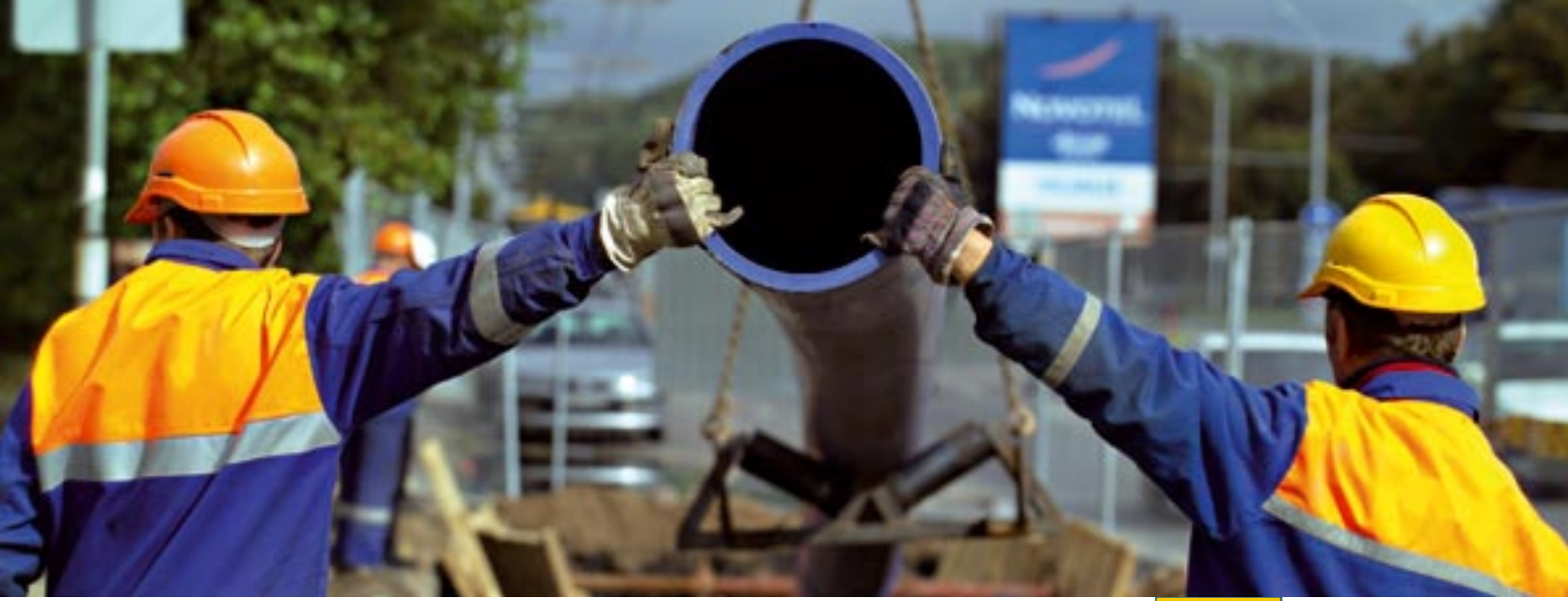
Su/kanalizasyon altyapısı için yeni borular, Litvanya