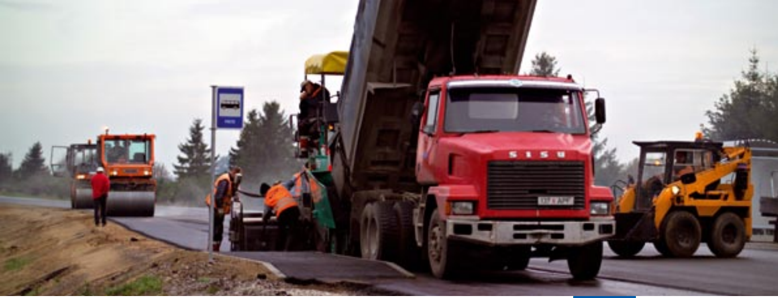
Estonya'da yeni yollar: Via Baltica otoyolu

Fonu, Uyum Fonu ve Avrupa Sosyal Fonu'dur. Bu araçların tutarı, 2007 ve 2013 yılları arasında toplam 347,4 milyar Avro olacak ve bu tutarın %82'si, AB'nin en zayıf bölgelerine yatırılacaktır. AB uyum politikasının sağladığı katma değer dikkate değerdir: