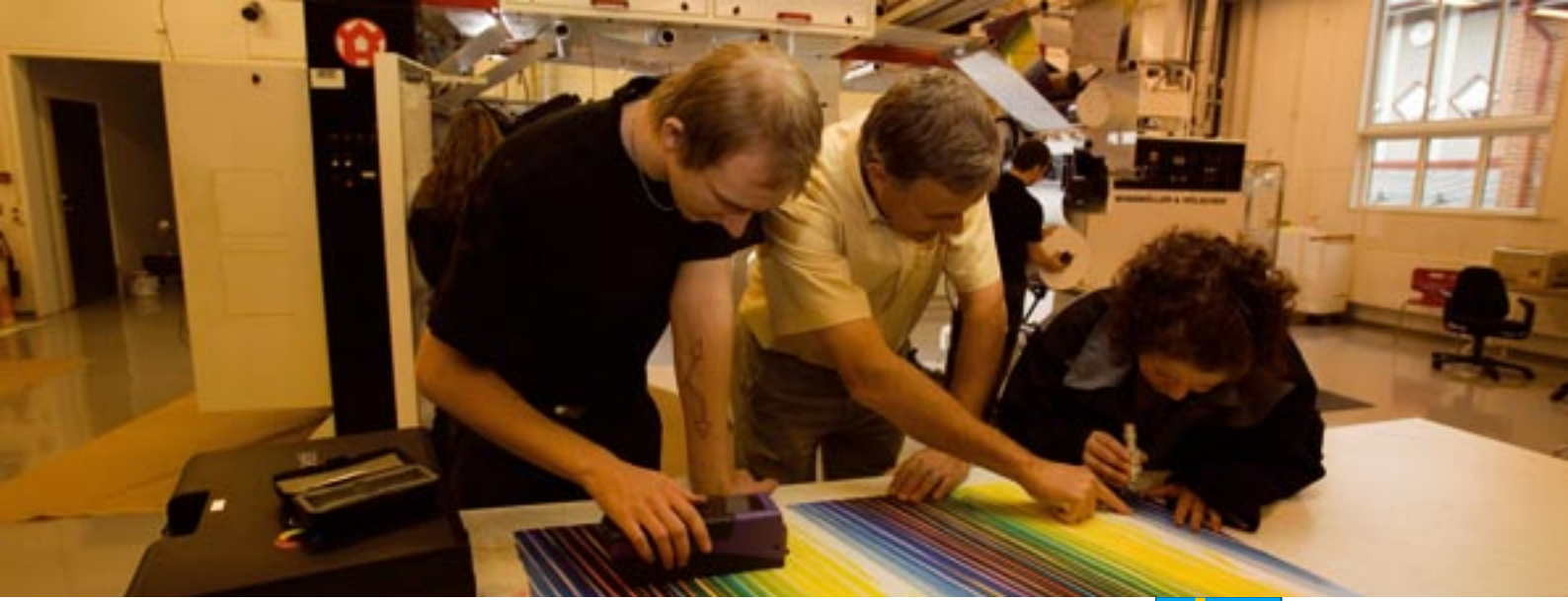
Brobygrafiska, İsveç'te grafik endüstrisinde yenilik