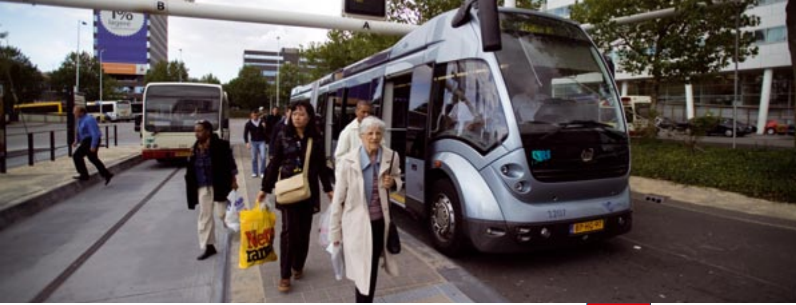
Phileas: taşımacılık sektöründe bir yenilik, Hollanda