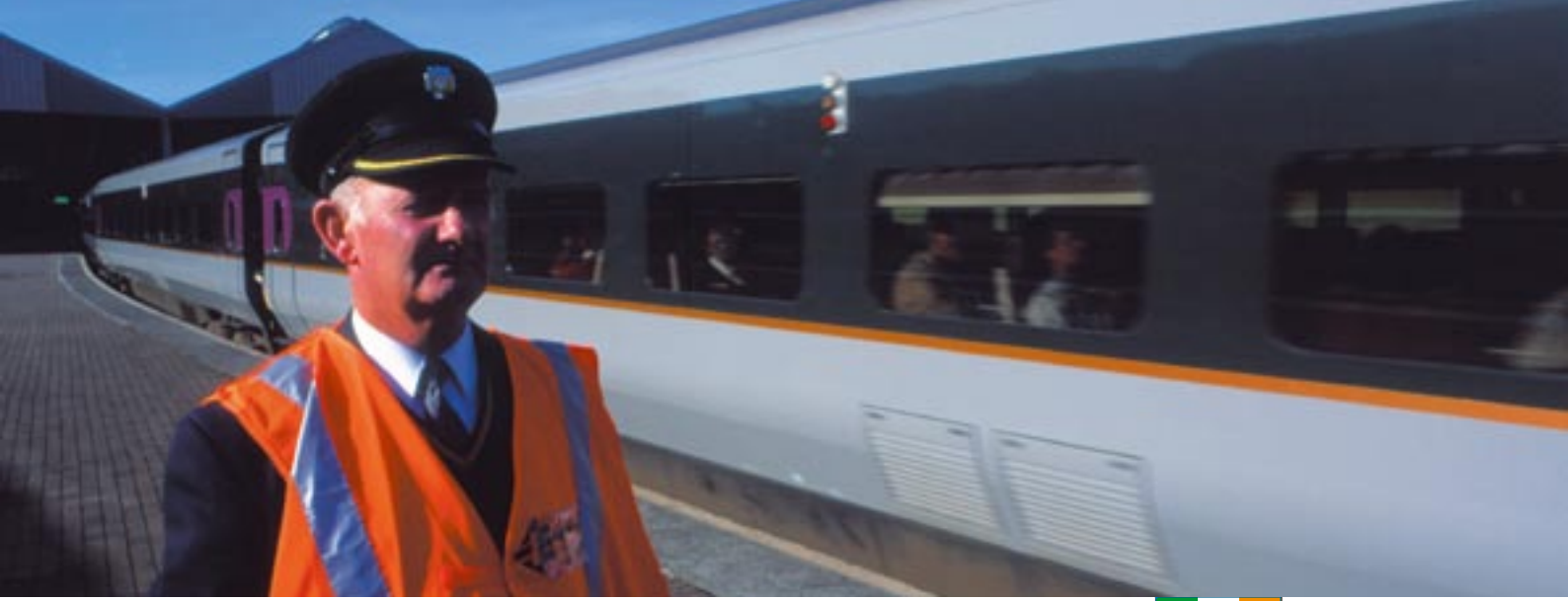
Belfast demiryolu, Dublin, İrlanda