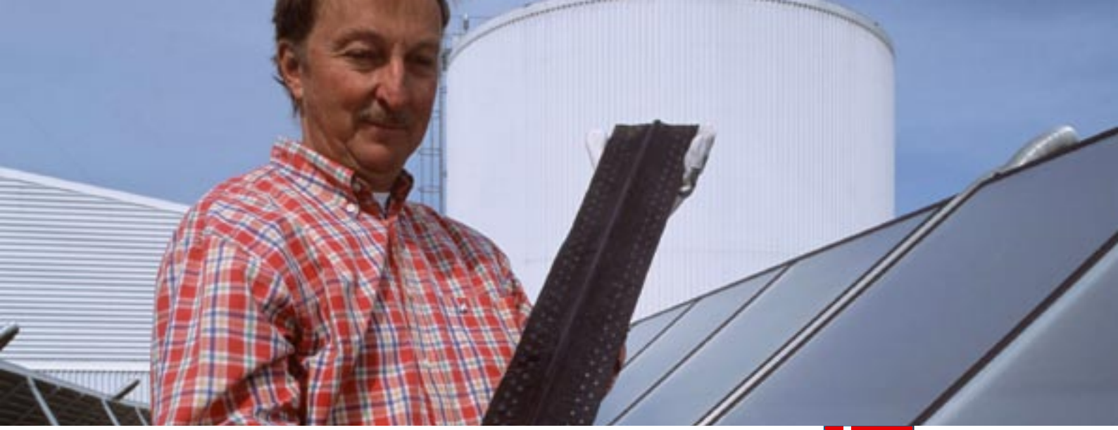
Enerji tasarruflu kaynakların desteklenmesi: Martsal, Fyns amt, Danimarka'da güneş panelleri