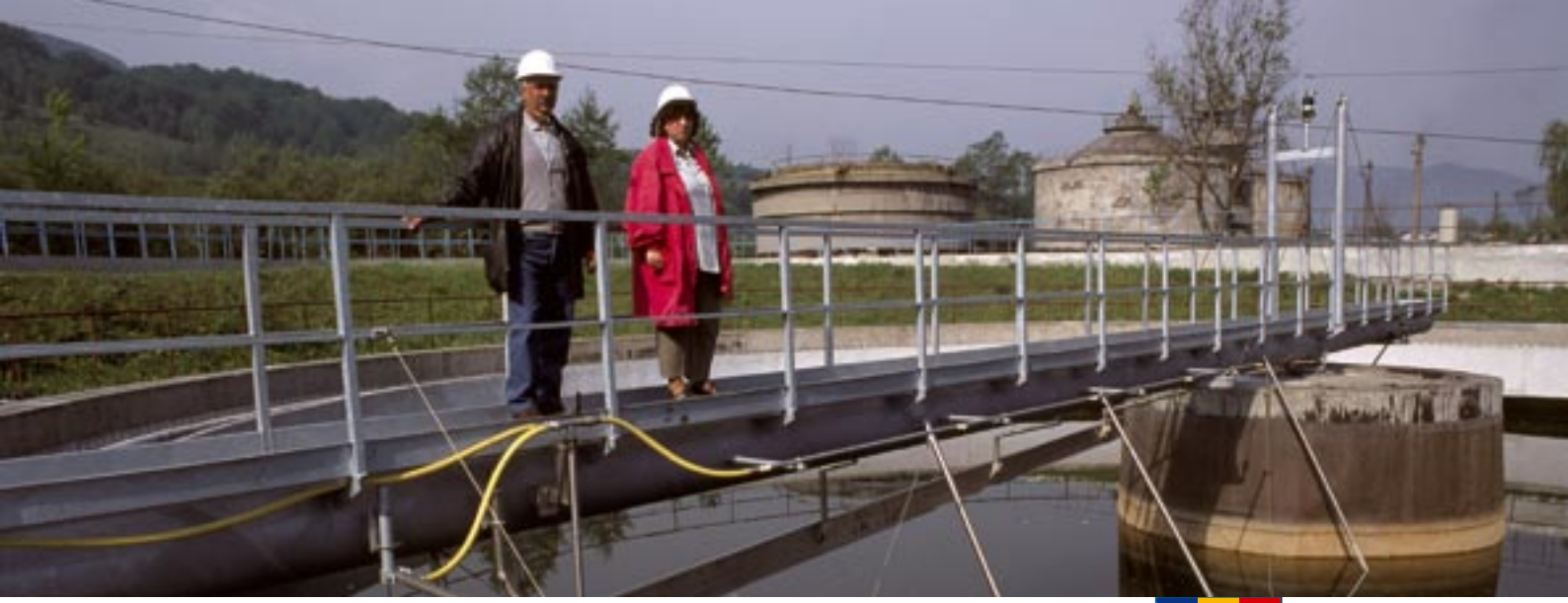
Danutoni'nin Petrosani yakınlarında yeni su arıtma tesisi, Romanya