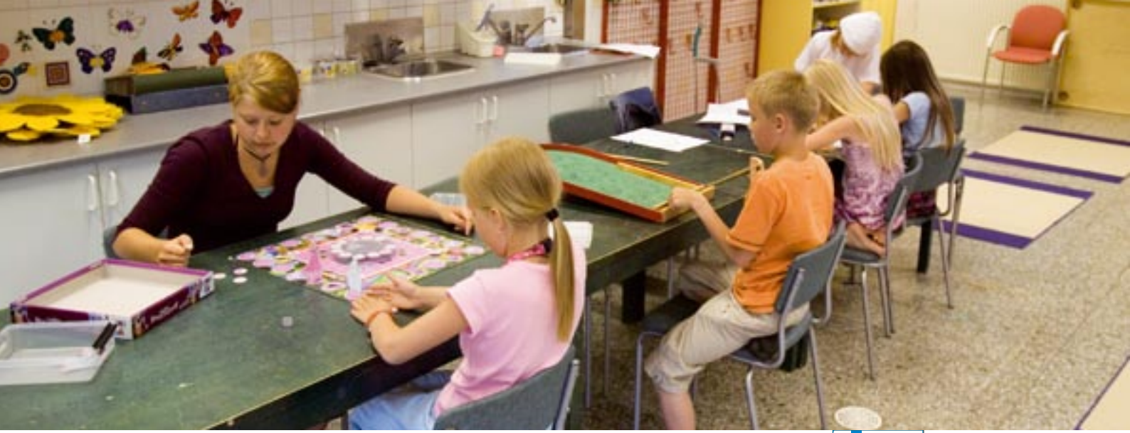
Topluluk hizmetleri; ilkokul çocukları için öğleden sonra eğitim merkezi, Lastenkaari, Finlandiya