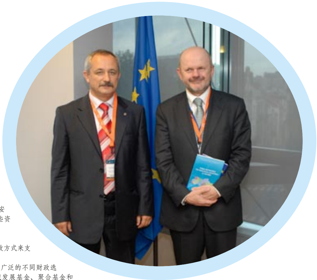
乌克兰，基辅。该国家于2009年7月和欧盟委员会签订了谅解备忘录。

将财务交给不同的财政机构，如欧洲投资基金，进行管理，管理权力机构就可以引进该区域内信贷商业发展的外部援助，如贷款，包括冒险性资本或原始资本。