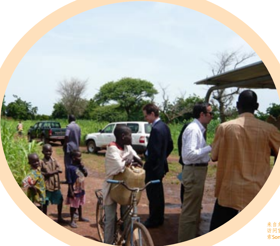
来自危险品（DG）区域开发以及危险品开发部门的访问官员，会见了位于欧盟援建的村落基地布基纳索Song Naba中的村民。

作为帮助新成员国的更深层次的方法，协助新成员国草拟合理的草案，在正式批准之前，帮助他们通过所有的财政和技术审批程序。JASPERS（支持欧洲地区项目联合补助）是一家以资金方式将欧洲委员会的资助集中起来，招募专家人员，并充分利用欧洲投资银行（EIB）和欧洲复兴发展银行员工支援的机构。