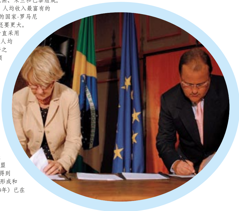
2007年11月29日，Hübner委员和巴西全国一体化部长热达尔维埃拉利马在巴西利亚共同签署了欧盟委员会和巴西之间区域政策合作的谅解备忘录。

区域发展的原则多年来已被测试过多次，并被重复定义过多次，希望可以传达一种涵盖广泛领域的政策，如迎接经济与社会挑战的政策、达到经济发展目标的政策。该政策的成功依赖于整个欧盟的合作、精心规划和高效的管理。当这些原则都已经准备就绪，发展规划就可以在各成员国或地区分别进行。