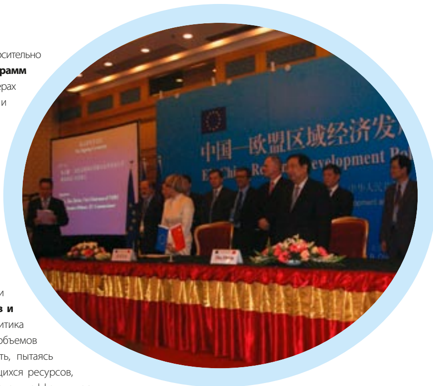
15 мая 2006 г. подписан меморандум о взаимопонимании с Китаем в вопросах обмена информацией и передовых практик разработки и осуществления стратегии сближения.

государственных закупок); уважение к экологической политике и правилам; уважение к принципу равных возможностей; подход, основывающийся на партнерстве и демократии. В ЕС несоблюдение вышеуказанных условий часто приводило к применению финансовых санкций.