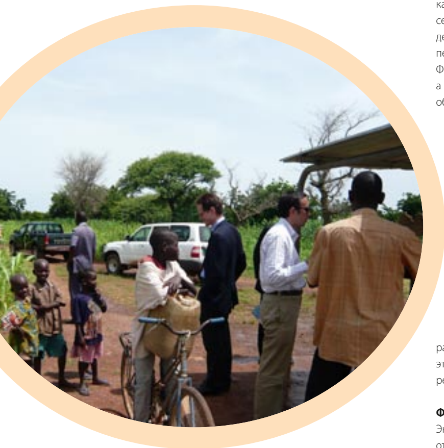
Посещение официальными лицами из отдела регионального развития DG и отдела развития DG, их встреча с крестьянами Сонг-Наба, Буркина-Фасо, у сельского колодца, построенного при содействии ЕС.

Экономический рост зависит не только от инвестиций, но также и от механизмов эффективного управления программами развития, уделяя при этом надлежащее внимание эффективному управлению государственными ресурсами. В свою очередь, это создает потребность в работоспособной и надежной административной системе и прозрачном правовом поле. Новая система реализации региональной политики ЕС в 2007-2013 годах включает поддержку конкретных программ лишь с целью создания условий для административной реформы и обучения государственных служащих последним управленческим методам.