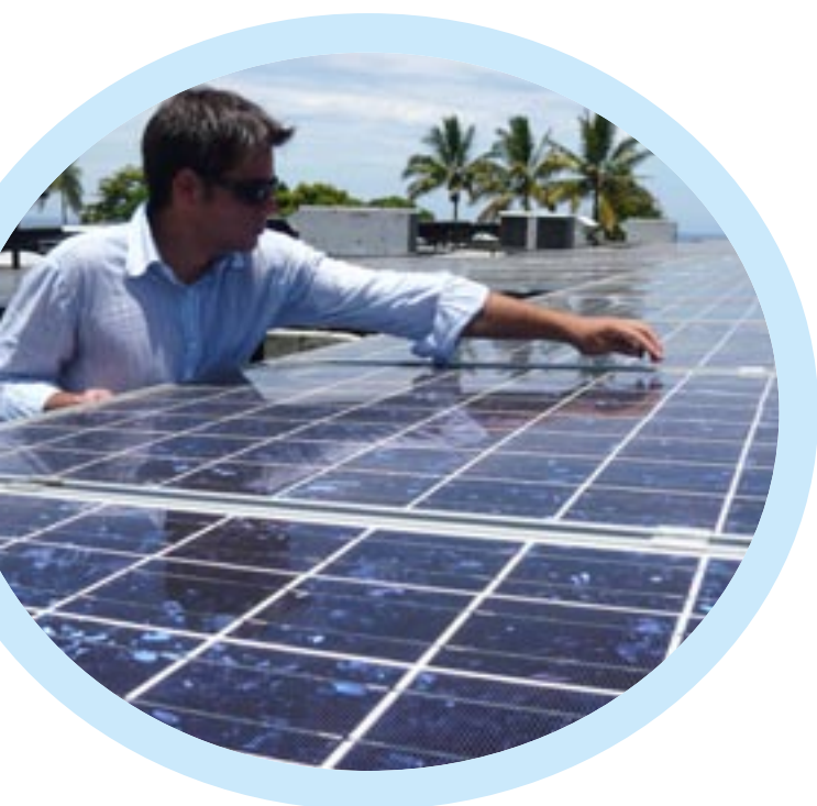
Финансирование борьбы с климатическими изменениями

конкурентоспособностью, включая инвестиции в инфраструктуру. Фонд сближения больше сосредотачивается на транспортной и экологической инфраструктуре, включая возобновляемые источники энергии. В-третьих, финансирование в рамках Европейского социального фонда направляется на инвестиции в человеческий капитал в сфере образования и профессиональной подготовки.