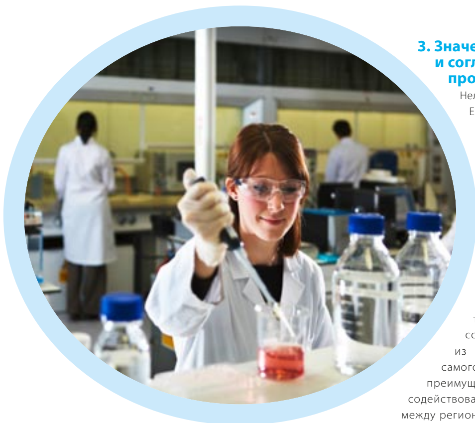
Региональная политика занимает центральное место в работе по улучшению конкурентных позиций ЕС.

Стимулирование трансграничного, транснационального и межрегионального сотрудничества (которое является одним из элементов региональной политики ЕС с самого ее начала) обеспечило значительные преимущества. С одной стороны, способность содействовать развитию конструктивных контактов между регионами через внешние границы ЕС помогла многим странам-кандидатам подготовиться к исполнению обязанностей, связанных с членством в ЕС, а также помогла убедить население в определенных выгодах в результате членства в ЕС. С другой стороны, сотрудничество между регионами через внутренние границы ЕС укрепило отношения между иногда относительно поделенными или