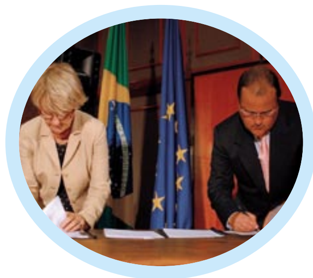
Комиссар Хебнер и г-н Геддель Виэйра Лима, министр национальной интеграции Бразилии, подписали меморандум о понимании между Европейской Комиссией и Бразилией в вопросах сотрудничества в рамках региональной политики Бразилиа, 29 ноября 2007 г.

сети. Современные транспортные сети указывают на путь к устойчивой, эффективной и безопасной мобильности, улучшая доступ ко всем регионам. Рассматривая эти инвестиции в контексте более широких усилий, направленных на улучшение экономического развития и конкурентоспособности, региональная политика ЕС пытается обеспечить, чтобы эти сети давали регионам шанс не только импортировать, но и экспортировать. Именно поэтому программы по разработке политики сближения всегда являются интегрированными программами. Другие принципиально новые события происходили в экологических программах, где инновационные и эффективные технологии используются в качестве источника экономического роста, а также в сфере сохранения природных ресурсов и предотвращения непоправимого экологического ущерба.