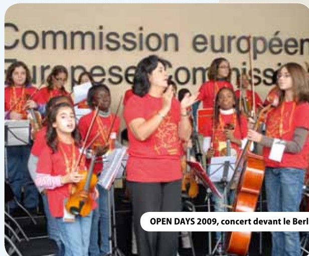
OPEN DAYS 2009, concert devant le Berlaymont