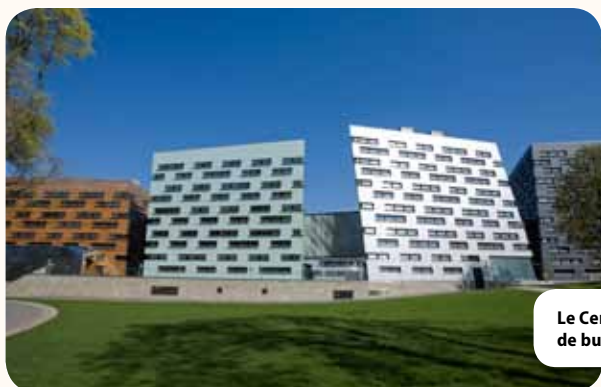
Le Centre commercial de Basse-Autriche — l'un des plus grands immeubles de bureaux d'Europe construit sur le modèle des maisons passives

C'est la compétitivité des régions d'Europe qui est en jeu derrière le défi d'une utilisation efficace des ressources. Fin 2008, la Commission européenne a adopté une proposition pour accélérer les investissements relatifs à l'efficacité énergétique et aux énergies renouvelables dans les logements. L'objectif est de permettre une économie d'énergie, une réduction des émissions et un allègement des factures de combustible pour les personnes les plus vulnérables, tout en contribuant à la relance du secteur du bâtiment.