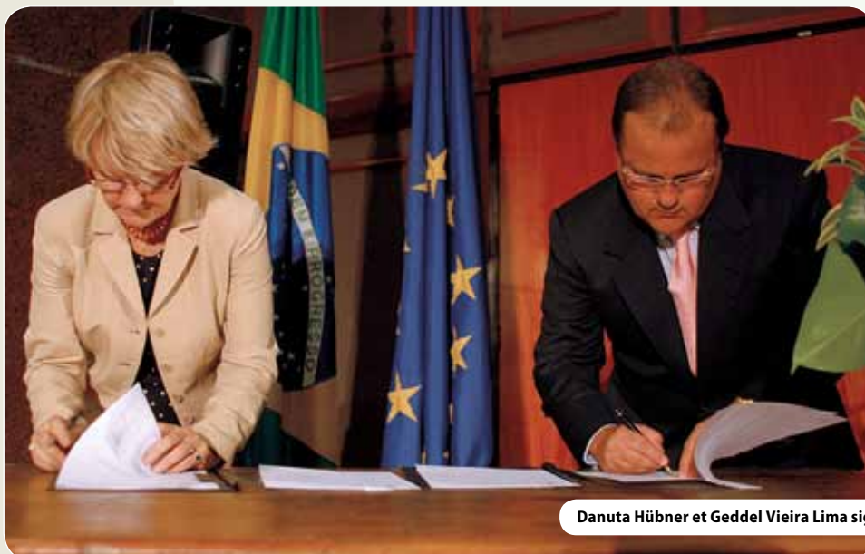
Danuta Hübner et Geddel Vieira Lima signent un protocole d'accord

En 2009, le dialogue est passé à la vitesse supérieure, impliquant directement des régions de part et d'autre. En particulier, un échange de programmes pour des représentants de cinq «mésorégions» brésiliennes (régions prioritaires dans l'élaboration de la politique brésilienne) a été organisé en octobre 2009 pour visiter des régions européennes en vue de voir et de discuter la manière dont la politique régionale est définie et mise en œuvre. Cet échange a montré à quel point la coopération entre régions peut relancer le développement économique et de quelle façon la diversification des économies urbaines et rurales peut mener à une croissance globale plus élevée.