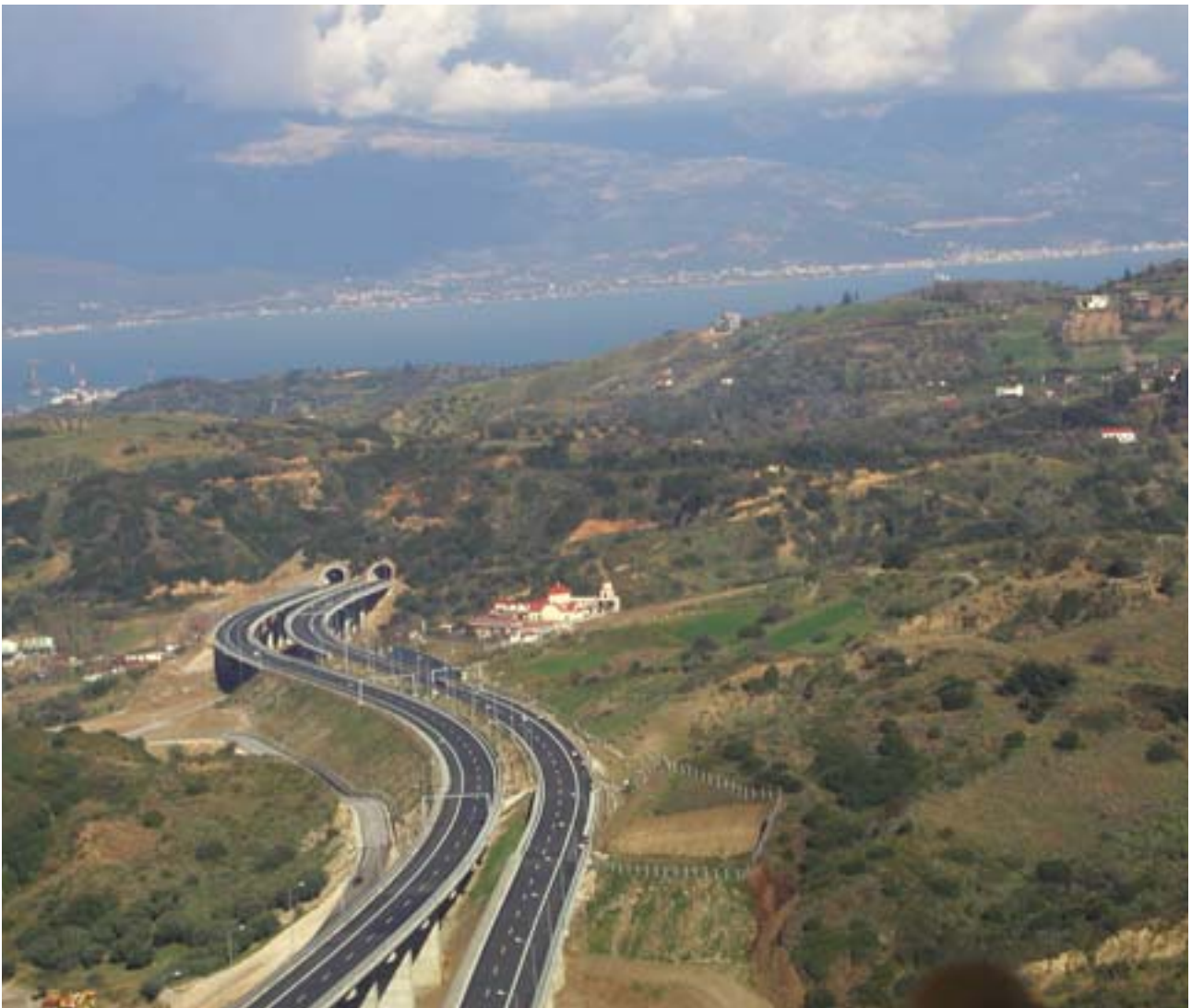
Sammanhållningsfonden bidrar till finansieringen av motorvägen Patras-Aten-Tessaloniki (Grekland).

Som svar på en ofta uttryckt farhåga fastställs i den föreslagna förordningen att stöd från fonderna skall återtas om, inom en period av 7 år, större ändringar görs i ett företag eller en offentlig myndighet, eller sker p.g.a. att en produktiv verksamhet upphör, t.ex. efter en utlokalisering. Ett företag som är eller har varit föremål för ett återbetalningsförfarande får inte längre ta emot något stöd från fonderna.