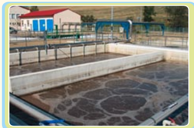
Čistenie odpadových vôd pre ochranu životného prostredia

Projekt Myjava bude mať vplyv na zamestnanosť, pretože jeho realizácia bude znamenať zachovanie asi 10 pracovných miest.