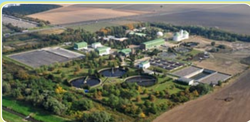
Szennyvíztisztítás és környezetvédelem