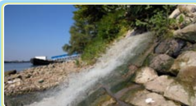
Откриване на по-добър начин за управление на водата и отпадъците

Европейски социален фонд http://ec.europa.eu/social/