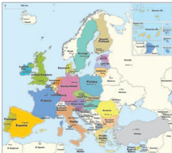
Az Európai Unió tagállamai, 2009