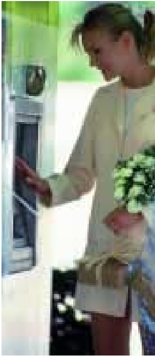
Deve ser possível usar cartões de crédito em toda a parte sem riscos de fraude.

Em Maio de 2000, a União aprovou um diploma que visava facilitar a aceitação e execução em outros países da UE de sentenças em matéria de divórcio, separação e anulação de matrimónio e normalizar as regras de jurisdição dos Estados-Membros neste domínio. Deverá assim facilitar-se a situação de pessoas a quem foi concedido o divórcio com condições relativas a custódia e responsabilidade parental pelos filhos de ambos os cônjuges. Nos termos deste regulamento, aquelas decisões serão reconhecidas e executadas em todos os Estados-Membros, o que permitirá aos tribunais lidar com situações em que um progenitor viole o acordo de divórcio, sonogando um filho ao outro progenitor e levando-o para residir em outro país da UE.