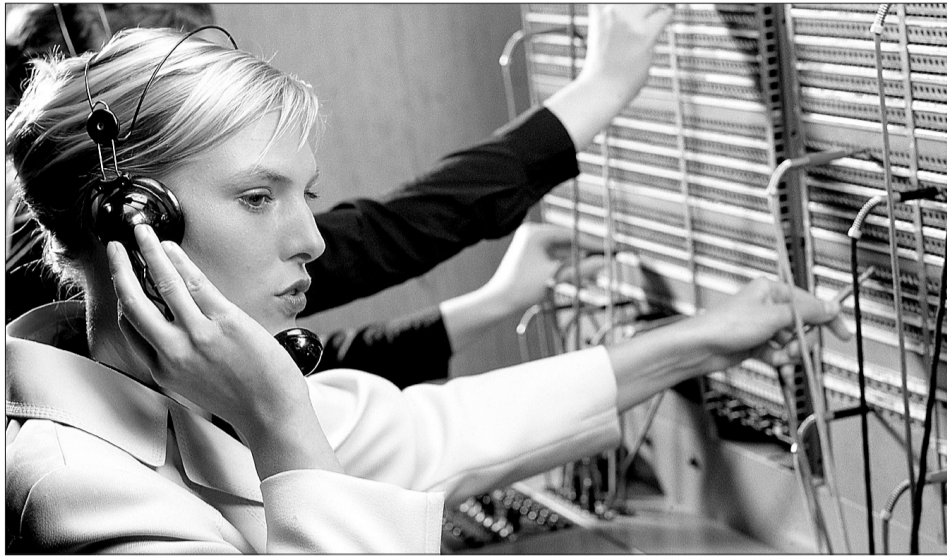
Latvijā palīdzības dienesta dispečeri ar zvanītājiem spēj sarunāties trīs svešvalodās – krievu, angļu un vācu.

Jautājot par valodām, kādās dienestu dispečeri sarunājas ar zvanītājiem, 16 valstis (Austrija, Bulgārija, Čehija, Dānija, Vācija, Igaunija, Somija, Francija, Ungārija, Grieķija, Lietuva, Malta, Nīderlande, Slovēnija, Spānija un Zviedrija) norādīja, ka lielākā daļa nelaimē nokļuvušo runā angļu valodā. Septiņas dalībvalstis (Bulgārija, Vācija, Igaunija,