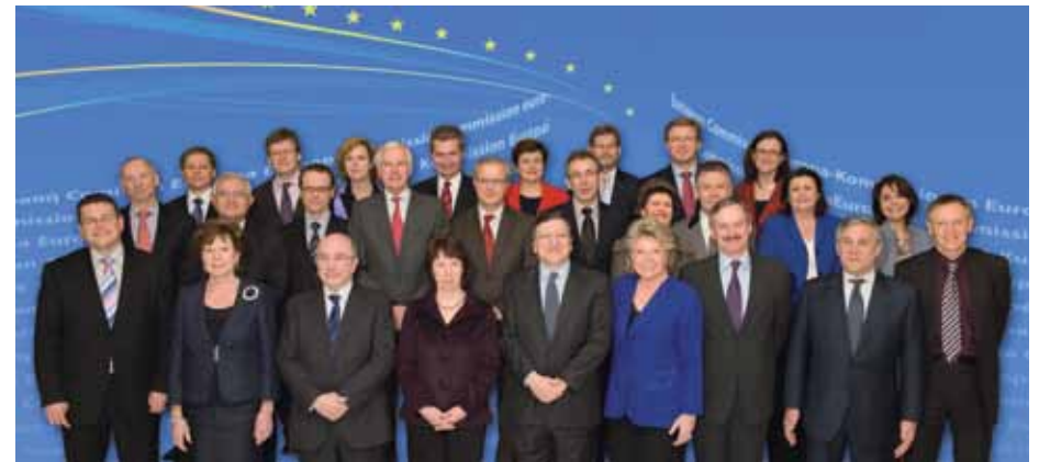
José Manuel Barroso, Président de la Commission européenne

“ Le Marché unique a toujours été le moteur de notre développement économique et de notre prospérité. Il reste plus que jamais notre meilleur atout face à la crise. Ces douze chantiers permettront de lui redonner une impulsion décisive au service des entreprises, des travailleurs et des consommateurs. Notre objectif: un Marché unique plus fort en 2012. ”