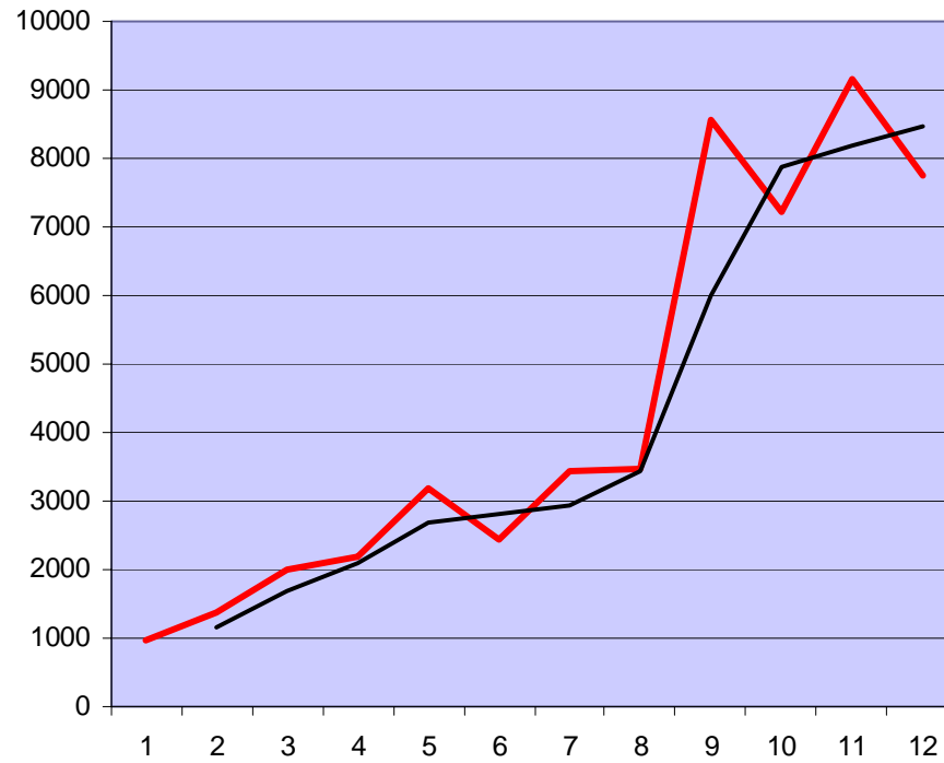
Total number of seizures by German Customs 1995-2007