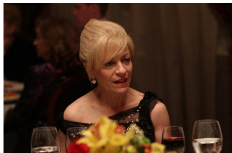
► Poziția copilului / Child's pose