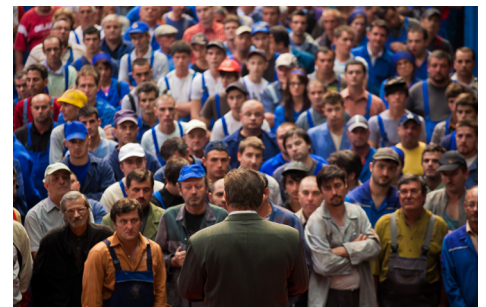
► Despre oameni și melci / Of snails and men