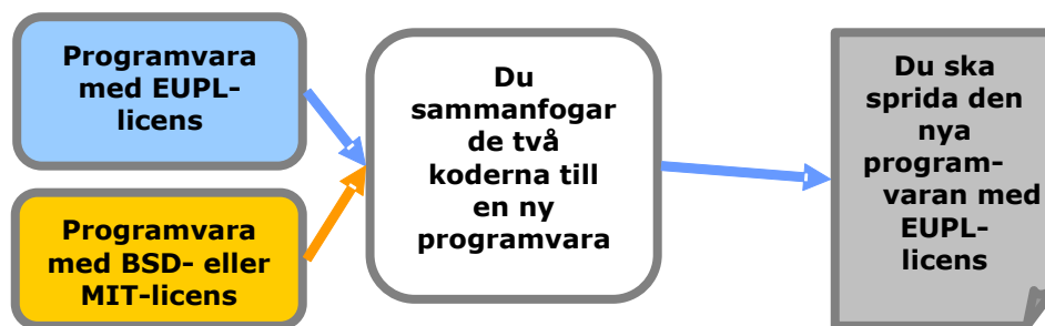
Figur 3: Sammanfogning med tillåtande källkod

Om du bestämmer dig för att sprida det härledda verket ska du göra det enligt villkoren i EUPL. Det är en skyldighet som uppstår genom artikel 5 i EUPL (copyleft-klausulen).