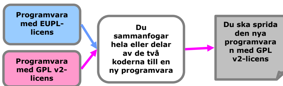
Figur 2: Kompatibilitetsklausul

Tänk på att när du bygger programlösningar med olika Open Source-komponenter är det sällan obligatoriskt att sammanfoga eller länka deras kod i en enda källa. De olika komponenterna i lösningen brukar utbyta och bearbeta parametrar utan att sammanfogas. Då kan också varje komponent i lösningen förbli licensierad enligt sin originallicens.