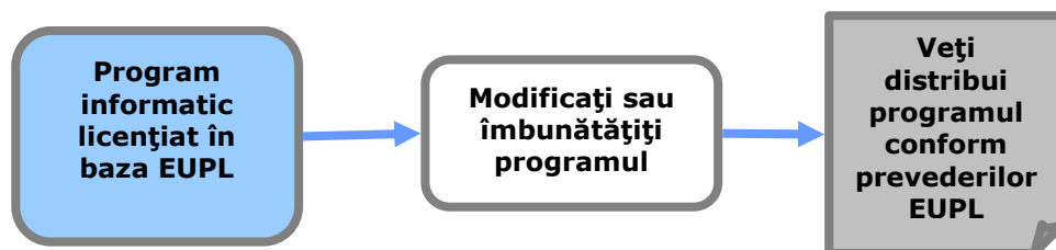
Figura 1: Efectul „copyleft”