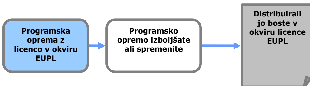
Slika 1: Učinek „svobodnih avtorskih pravic“

Če ste ustvarili izpeljano delo (kar pomeni, da ste programsko opremo spremenili, dodali funkcije, prevedli vmesnik v drug jezik itd.) in če to novo delo distribuirate, morate za celotno izpeljano delo prav tako uporabiti isto licenco EUPL (brez spreminjanja licenčnih pogojev).