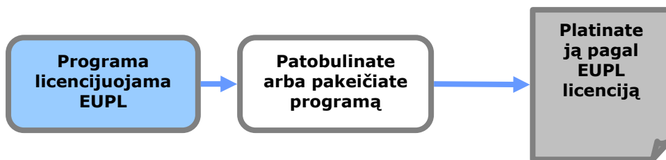
1 pav. Kopijavimo teisės išsaugojimo poveikis

Jei sukūrėte išvestinį kūrinį (t. y. pakeitėte programinę įrangą, įtraukėte papildomų funkcijų, išvertėte sąsają į kitą kalbą ar kt.) ir platiniate šį naują kūrinį, visam išvestiniam kūriniui turite taikyti tą pačią EUPL (nekeisti licencijos sąlygų).