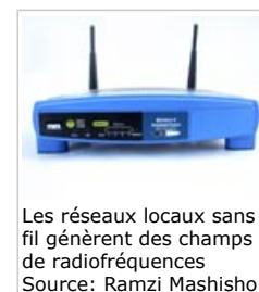
Les réseaux locaux sans fil génèrent des champs de radiofréquences

Les champs de radiofréquences (RF) sont largement utilisés dans les communications modernes. Les sources les plus connues sont les téléphones portables, les téléphones sans fil, les réseaux locaux sans fil et les tours de transmission radio. D'autres appareils utilisent également des champs de radiofréquences : les scanners médicaux, les systèmes de radar et les fours à micro-ondes. Les radiofréquences varient de 100 kHz à 300 GHz.