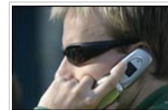
Plus de 2 milliards de personnes à travers le monde utilisent un téléphone portable

3.1 Ces dernières années, de nombreuses études ont cherché à établir si les téléphones portables et les champs de radiofréquences (RF) en général pouvaient causer le cancer. Les études épidémiologiques sur les utilisateurs de téléphones portables se sont principalement intéressées aux cancers qui se déclarent dans la tête, en particulier les tumeurs cérébrales. Globalement, ces recherches révèlent que l'utilisation du téléphone portable n'augmente pas le risque de cancer, surtout en-dessous de 10 ans d'utilisation. Les conclusions d'études publiées dans le cadre du projet Interphone, qui rassemble des données de 13 pays, appuient cette conclusion. Des recherches supplémentaires sont nécessaires pour déterminer s'il existe un risque associé à une utilisation à long terme du téléphone portable bien au-delà de 10 ans.