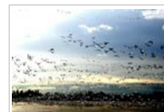
Les oiseaux migrateurs utilisent les champs magnétiques pour s'orienter

Les études de terrain sur des espèces spécifiques d'animaux et de plantes vivant à proximité immédiate de sources de champs électromagnétiques fournissent des informations sur les effets possibles sur les écosystèmes.