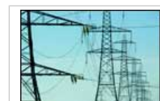
Les lignes électriques génèrent des champs d'extrêmement basses fréquences (ELF)

7.1 Les extrêmement basses fréquences (ELF) sont celles qui sont inférieures à 300 Hz. Ces champs sont par exemple générés par le courant alternatif (CA) utilisé dans la plupart des lignes électriques, câbles et appareils ménagers. Parmi les autres sources importantes d'extrêmement basses fréquences, on peut citer les générateurs utilisés dans les centrales électriques, les machines à souder, les appareils de chauffage à induction, ainsi que les systèmes utilisés par les trains, les tramways et les métros.