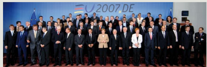
• Les chefs d'État européens réunis lors du sommet européen de Bruxelles, le 22 juin dernier.

• ec.europa.eu/commission_barroso/borg/index_fr.htm