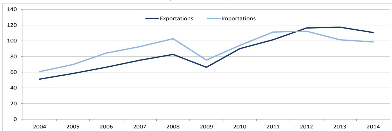
Évolution des exportations et importations de biens de l'UE avec la CELAC, 2004-2014 (en mrds d'euros)

À l'occasion du deuxième sommet Union européenne – CELAC 2 , qui se déroule les 10 et 11 juin à Bruxelles, Eurostat , l'office statistique de l'Union européenne, publie des données sur le commerce de biens entre les membres de la CELAC et l'UE.