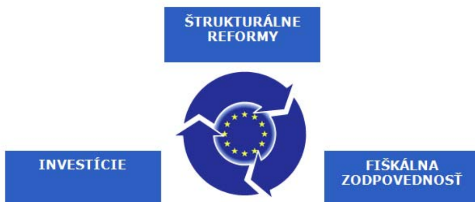
Graf č. 1. Integrovaný prístup