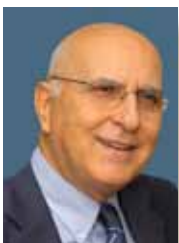
Stavros DIMAS Commissaire à l'environnement Commission européenne Bruxelles

La Commission européenne et les Nations unies, à travers leur convention sur la lutte contre la désertification, s'accordent à dire que si nous ne préservons par les matières organiques des sols en Europe et partout ailleurs dans le monde, nous ne bénéficierons pas longtemps de sols productifs, nous ne pourrions pas faire face à des pénuries d'eau prolongées ni à des périodes de pluies intenses plus fréquentes et nous ne pourrions pas inverser la tendance inquiétante de dégradation des terres et de désertification. Nous sommes convaincus que les présentations et les débats de la conférence résumés dans ce rapport apporteront des informations utiles aux responsables et aux décideurs politiques concernés par la gestion des sols à tous les niveaux.