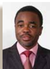
Luc GNACADJA Secrétaire exécutif de la Convention des Nations unies sur la lutte contre la désertification Bonn