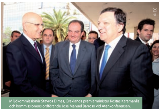
Miljökommissionär Stavros Dimas, Greklands premiärminister Kostas Karamanlis och kommissionens ordförande José Manuel Barroso vid Atenkonferensen.

Det finns flera medel både inom EU och internationellt som skulle kunna nyttjas för att stödja bevarandet av den biologiska mångfalden. Men i praktiken är de tilldelade finansiella medlen inte tillräckliga för att täcka det reella behovet. Om det nuvarande systemet inte fungerar, måste nya sätt att finansiera dessa projekt tas fram. Även den privata sektorn bör uppmanas att bidra. Stödåtgärder bör ses över för att kunna hitta och avveckla sådana som har en negativ inverkan på den biologiska mångfalden.