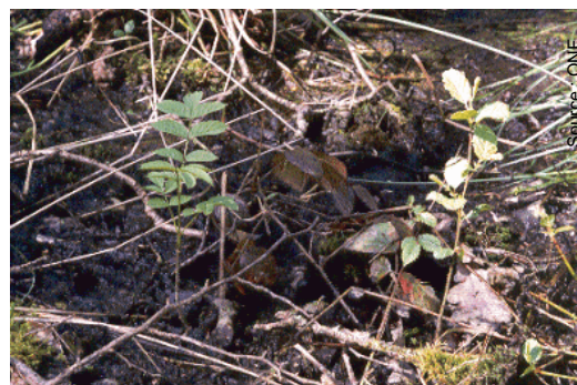
Sur une petite exondation voisine, le frêne, le chêne et le charme s'installent à l'ombre du peuplement