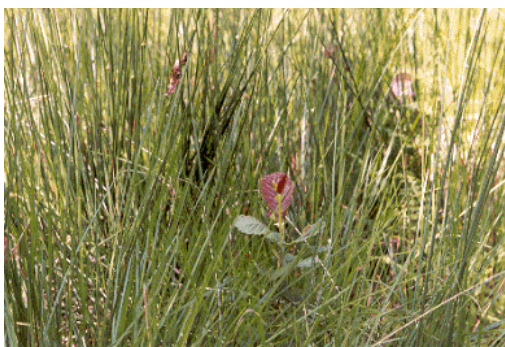
Semis d'aulne en terrain nu et en pleine lumière

Sur certains sols, la réussite des régénérations naturelles peut être favorisée par des techniques de scarification légère de l'humus (Dubourdiou, 1997). Les radicules issues des graines ont ainsi accès plus facilement à l'horizon organo-minéral dans lequel elles s'ancrent et puisent leurs besoins en eau et en éléments minéraux.