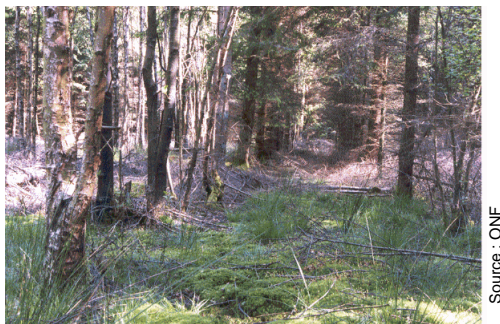
Pessière sur sol hydromorphe

Leur croissance en hauteur est limitée. Ces arbres ont une forme tronconique "en carotte" peu appréciée des scieurs. Ils sont également sensibles aux forts coups de vents et au tassement du sol sous les roues des engins de débardage.