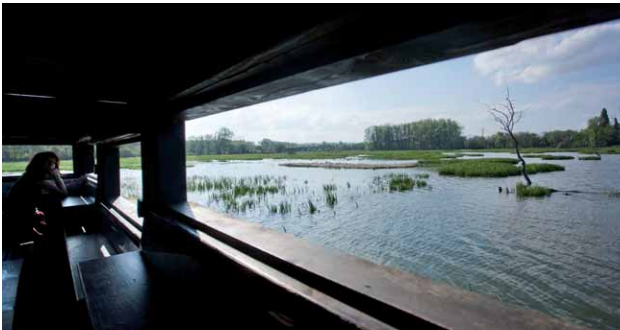
Observatorio de aves acuáticas en Salburua, uno de los parques del Anillo Verde.