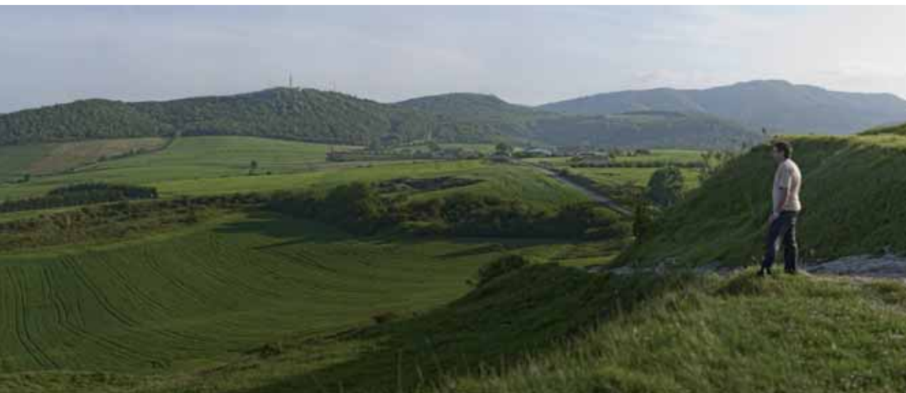
Bosques y cultivos que rodean Vitoria-Gasteiz, el municipio más grande del País Vasco.

El programa de divulgación de la Green Capital 2012 de Vitoria-Gasteiz, con su atractivo eslogan Verde por fuera, verde por dentro , ofrece una impresionante diversidad de actividades, eventos, acciones y oportunidades de creación de redes todo el año, y demuestra la fuerte motivación de la ciudad para compartir ideas y difundir las mejores prácticas. Incluye varias ideas originales, como el programa de voluntariado Ekolabora, y un concurso interescolar a escala europea.