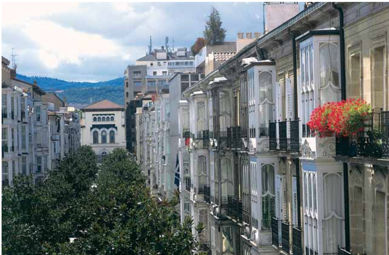
La calle Dato, en el centro de la ciudad, con sus típicos miradores, un ejemplo de diseño sostenible en el siglo XIX.

El objetivo a largo plazo de la ciudad es convertirse en una zona neutra en carbono, con una meta provisional de reducción de las emisiones a la mitad de aquí a 2050, mediante acciones de amplio alcance en distintos sectores y en la educación pública.