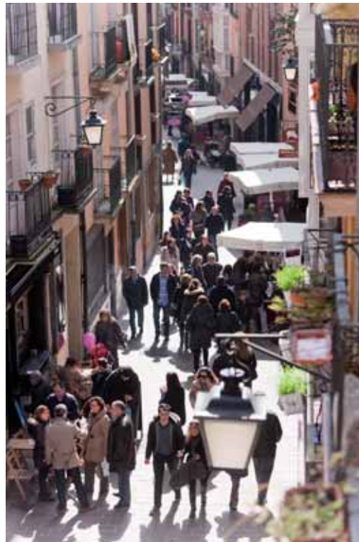
Calle comercial en pleno Caso Medieval de la ciudad.

Vitoria-Gasteiz, una ciudad tradicionalmente industrial, prosperó gracias a los sectores de la aeronáutica, energía y máquina herramienta. Más recientemente, los servicios y las nuevas tecnologías han ganado en importancia. Las empresas ocupan más de 9,5 millones de m 2 del término municipal, y el parque empresarial de Jundiz es uno de los más grandes del norte de la Península Ibérica.