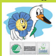
Svante il cigno e Maggie il fiore.

Fra le ulteriori azioni previste dalla campagna sono da segnalare un'applicazione online relativa a un libro da colorare con Maggie e Svante e la storia illustrata. Visitare la pagina Facebook per ulteriori informazioni.