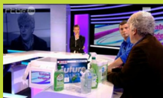
Copertura televisiva del mese del marchio Ecolabel UE in Belgio.

Il 1° settembre è stata lanciata una massiccia campagna di sensibilizzazione sul marchio Ecolabel UE, promossa tramite i social media e organizzata dal servizio pubblico federale belga per la salute, la sicurezza alimentare e l'ambiente. La campagna, con quasi 15.000 partecipanti, si è svolta fino al 6 ottobre, attirando l'attenzione sul marchio Ecolabel UE e contribuendo ad aumentare le vendite dei prodotti contrassegnati dal marchio. Nell'ambito di un concorso online i partecipanti hanno risposto a domande sul marchio europeo di qualità ecologica e ai vincitori è andato un fiore virtuale da seguire online, mentre dei fiori veri sono stati piantati in una serra. I partecipanti hanno ricevuto premi in base al colore del loro fiore per un totale di 10.000 prodotti e servizi contrassegnati dal marchio Ecolabel. I dettaglianti belgi hanno offerto il proprio sostegno donando prodotti e promuovendo la campagna. Sono state realizzate pagine internet con l'elenco dei premi in palio per i consumatori e dei punti vendita dei prodotti che riportano il marchio Ecolabel UE; su queste pagine sono nati anche forum di discussione.