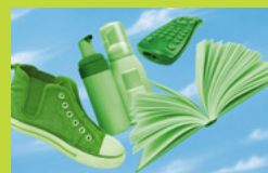
Un'immagine dalla campagna utilizzata in Piemonte per il mese del marchio Ecolabel UE.

Mostre, seminari e visite guidate sui prodotti contraddistinti dal marchio europeo di qualità ecologica sono stati il tema delle attività della regione Piemonte in occasione del mese dedicato al marchio Ecolabel UE, organizzate con il sostegno promozionale e tecnico di Ispra, Arpa e Unioncamere. Per la campagna ci si è avvalsi della collaborazione di enti politici e privati commerciali a tutti i livelli, attivi dalla predisposizione di materiali promozionali all'organizzazione di eventi sponsorizzati congiuntamente. Il mese del marchio Ecolabel UE in Piemonte ha previsto attività di diverso genere, che hanno coinvolto funzionari pubblici, insegnanti, imprenditori, studenti e consumatori in senso lato. Una mostra è stata l'occasione per istruire i partecipanti sulla scelta di prodotti rispettosi dell'ambiente. A essa ha fatto seguito l'esposizione di alcuni fra i prodotti piemontesi certificati con il marchio Ecolabel UE. In collaborazione con la Camera di Commercio di Vercelli il 27 ottobre è stata organizzata una visita guidata a uno stabilimento di saponi contrassegnati dal marchio Ecolabel UE. In tale occasione, i visitatori interessati hanno ottenuto utili informazioni sul ciclo di vita di un sapone certificato con il marchio Ecolabel UE.