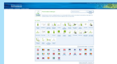
Schermata del nuovo catalogo elettronico.

Un motore di ricerca più efficiente offre ai visitatori del sito la possibilità di consultare il catalogo effettuando ricerche sia per gli Stati membri che per i paesi al di fuori dell'UE e di cercare un gruppo di prodotti o più gruppi di prodotti contemporaneamente. Inoltre, gli utilizzatori possono trovare sul catalogo i rivenditori dei prodotti di loro interesse così da poterli acquistare con facilità. I risultati possono essere ordinati in base al criterio definito dall'utente, ad esempio per prodotto o nome del produttore, paese, gruppo di prodotti o inserendo il nome di un dettagliante. Questa versione del catalogo elettronico sarà progressivamente migliorata e aggiornata per soddisfare le esigenze degli utenti.