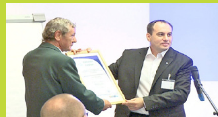
Seminario UE 12 a Budapest, 10 giugno.

I risultati raggiunti sono stati sorprendenti, sia in termini di esperienza per i nuovi organismi competenti, sia di maggiore consapevolezza fra le parti interessate e i rappresentanti del mondo industriale. I seminari hanno inoltre svolto un ruolo fondamentale nell'attrarre nuove richieste di licenze. La risposta collettiva dei partecipanti degli organismi competenti è stata ampiamente soddisfacente e ha evidenziato la volontà di continuare il lavoro e le attività di promozione del marchio Ecolabel UE.