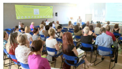
Seminario UE 12 a Riga, 7 giugno.

Per ulteriori dettagli, consultare in questa pagina la piattaforma del progetto.