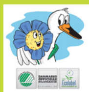
Svante le Cygne et Maggie la Fleur

Pour plus d'informations, vous pouvez consulter la page Facebook .