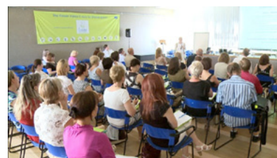
Atelier EU12 de Riga, 7 juin.