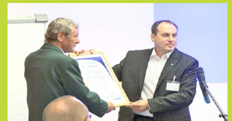
Atelier EU12 de Budapest, 10 juin.

Les ateliers ont donné des résultats remarquables, dans la mesure où ils ont permis aux nouveaux organismes compétents d'acquérir de l'expérience et où ils ont sensibilisé davantage les parties prenantes et les représentants du monde industriel. Ils ont également permis d'attirer de nouveaux candidats. Dans leur grande majorité, les participants des organismes compétents se sont déclarés très satisfaits et déterminés à poursuivre les travaux et les activités de promotion de l'écolabel européen.