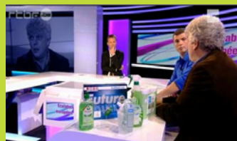
Couverture par la télévision belge du mois de l'écolabel européen

Les participants ont reçu des prix variant selon la couleur de leur fleur à l'occasion d'une distribution massive de 10 000 produits et services portant l'écolabel européen. Les détaillants belges ont aussi participé à l'événement en offrant des produits et en promouvant la campagne. Des pages web indiquant les types de prix à remporter et les points de vente des produits écolabellisés ont permis de créer un espace de discussion.