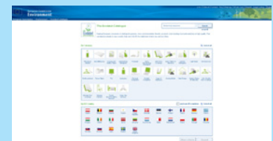
Capture d'écran du nouveau catalogue électronique.

Un moteur de recherche amélioré permet aux visiteurs du site d'effectuer des recherches dans le catalogue par État membre de l'UE mais aussi par pays tiers, ainsi qu'en sélectionnant un groupe de produits ou plusieurs groupes simultanément. En outre, les utilisateurs du catalogue peuvent trouver des détaillants pour les produits qui les intéressent, ce qui leur permet de savoir facilement où ils peuvent acheter les produits souhaités. Les résultats peuvent être triés sur la base d'un degré de pertinence déterminé par l'utilisateur, notamment en fonction du nom du produit ou du fabricant, du pays, de la catégorie de produits ou même en entrant le nom d'un détaillant. Cette version du catalogue électronique devrait être améliorée et actualisée graduellement afin de mieux répondre aux besoins de ses utilisateurs.