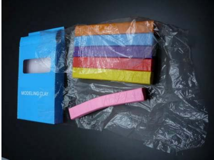
Illustration d'une feuille de plastique faisant partie de l'emballage:

La feuille de plastique sert d'emballage à la pâte à modeler; elle a pour fonction de la protéger contre les souillures et de l'empêcher de sécher durant son transport et son entreposage, mais elle n'est pas destinée au jeu.