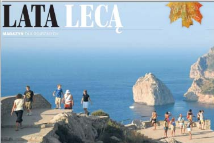
Widok na plażę z zlotu, na tle widać i wyspę zwisaną w Hiszpanii. Rozpływa się przy plaży Cap d'Audouard