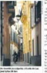
W tym kraju znajdziesz idealne warunki do wypoczynku. W tym kraju znajdziesz idealne warunki do wypoczynku.

ANNA PRZYBYŁA W tym kraju znajdziesz idealne warunki do wypoczynku. W tym kraju znajdziesz idealne warunki do wypoczynku. W tym kraju znajdziesz idealne warunki do wypoczynku.