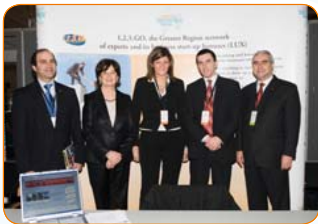
Personerna bakom Business Initiative npa från Luxemburg poserar tillsammans med Europeiska kommissionens representanter

Vinnare av Europeiska näringslivspriserna 2007