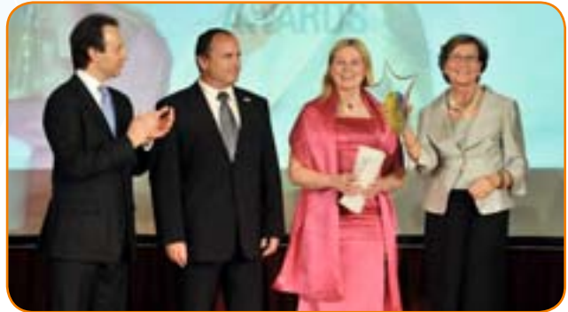
Personerna bakom Kunskap, kompetens, stöd – från entreprenör till entreprenör vinner priset Investeringar i kunskaper

Vinnare av Europeiska näringslivspriserna 2008/2009