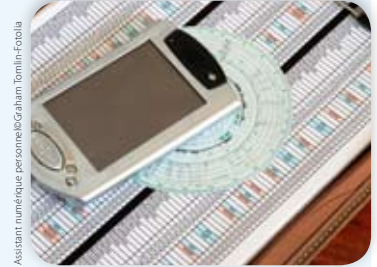
Assistant numérique personnel

La Commission cherche également à exempter les conducteurs non professionnels de l'obligation d'utiliser un tachygraphe pour des trajets de moins de 100 kilomètres, une mesure qui devrait bénéficier considérablement aux fermiers et aux artisans.