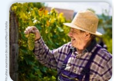
Viticulteur examinant des raisins