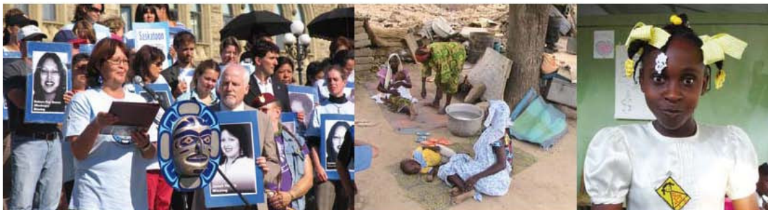
FOTOS D'ADMINISTRACIÓ INTERNACIONAL DEL NIQUORRE LA TRAMPA DEL GÈNERO, HUIDESSES, VIOLENCIA I POBREZA.

A mesura que ens apropem a l'any 2015, és necessari avaluar les necessitats dels països en desenvolupament uns quants anys més enllà. El pronòstic per al 2020 suggereix que 826 milions de persones (el 12,8% de la població dels països en desenvolupament) viuran amb 1,25 dòlars diaris