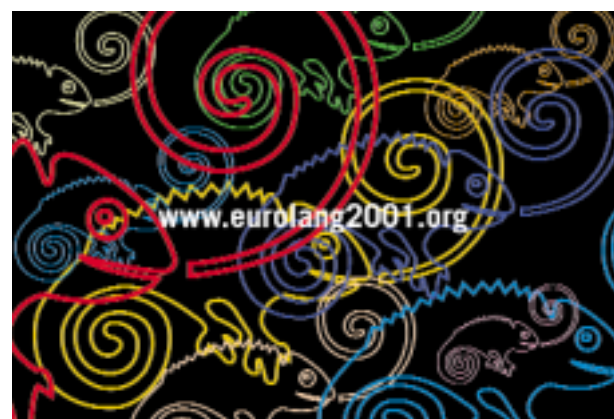
Postal del Año Europeo de las Lenguas