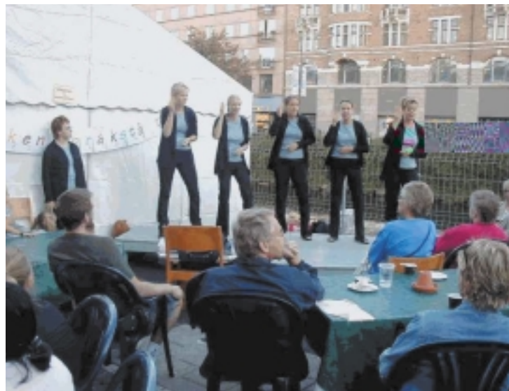
El coro de lenguaje de signos "Handbaletten" actuó en el Festival de Malmö como parte del proyecto "Lenguaje de signos para todos".

cofinanciados por la Comisión también buscaron promocionar los lenguajes de signos entre las personas que no sufren discapacidad auditiva, para que tomen mayor conciencia de las necesidades de las personas sordas.