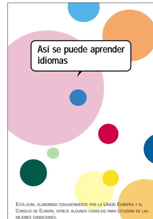
Guía del estudiante de idiomas, publicada en mayo por la Comisión y el Consejo de Europa

Éstos son algunos de los mensajes de la guía "Así se puede aprender idiomas" , que ofrece consejos sencillos para estudiar de manera eficaz. La guía fue publicada por la Comisión Europea y el Consejo de Europa en mayo del 2001, coincidiendo con la Semana europea de los adultos que aprenden idiomas (5-11 de mayo). Se han distribuido casi medio millón de copias.