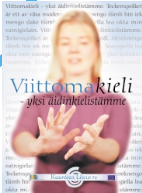
Póster de promoción del proyecto de la Asociación finesa de sordos