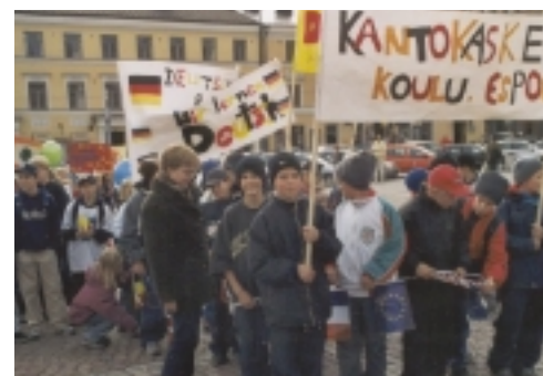
Niños finlandeses esperan el comienzo de la Marcha de las Lenguas en Helsinki, el 26 de septiembre

El globo del Año Europeo de las Lenguas suscitó gran atención con sus vuelos sobre Bruselas, Munich y Luxemburgo. En torno al globo se organizaron competiciones, concursos, juegos y otras actividades, dirigidas sobre todo a los niños. Los más afortunados también pudieron dar un pequeño paseo en globo. Este proyecto europeo fue coordinado por Euroscript en Luxemburgo .