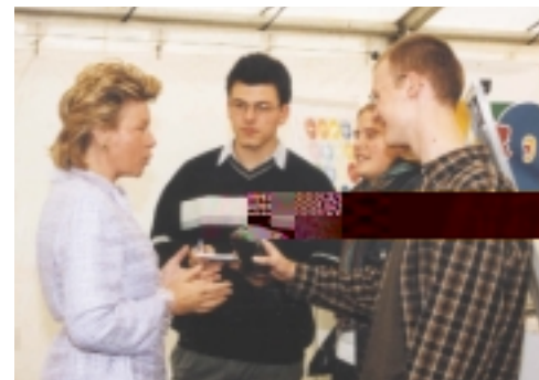
Futuros periodistas del proyecto Euroreporter se entrevistan con la Comisaria europea Viviane Reding.

La cadena de televisión internacional francesa TV5 , que llega a 130 millones de hogares en todo el mundo, produjo 90 vídeos para su colección " Le plaisir de mots, l'amour des langues " (el placer de las palabras, el amor a las lenguas). Los vídeos muestran a jóvenes hablando diversas lenguas europeas en situaciones que van desde conversaciones en el trabajo y en tiendas hasta una simple charla con amigos. Los productores se fijaron como objetivo "plasmarse simplemente el placer de hablar varias lenguas".