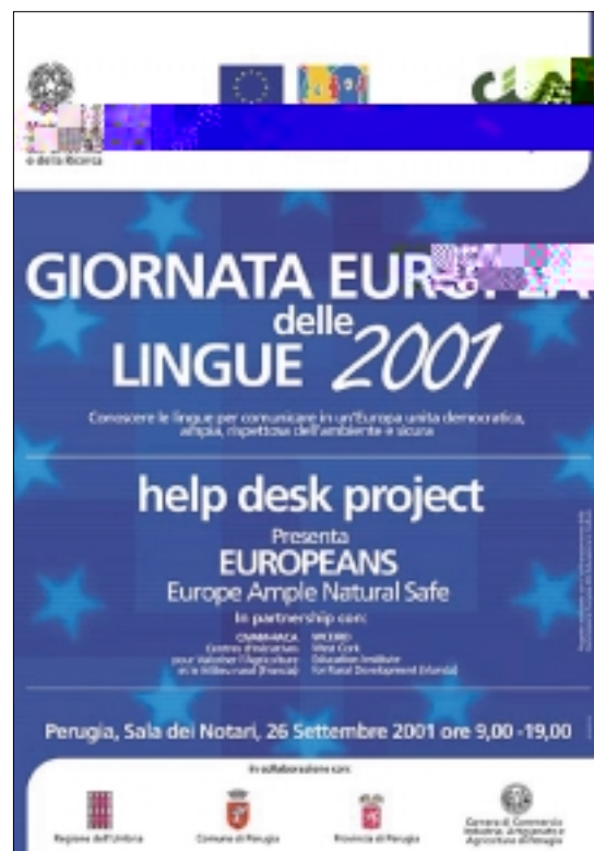
El proyecto "Help Desk" de Italia presentó este póster

El 51 % de la población de la UE estaría dispuesta a dedicar una hora o más a la semana al estudio de idiomas.