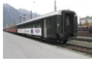
El tren de las lenguas que recorre el Tírol atrae un gran número de viajeros cada día