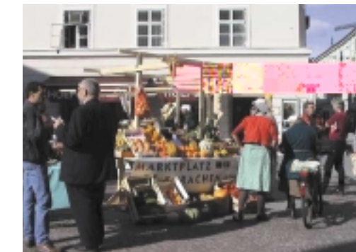
Aspecto del mercado de las lenguas en St. Pölten, Austria

Sus actividades incluían un concurso de vídeos, un