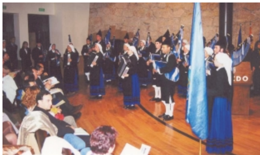
El acto KELTIC, en mayo en Asturias, se inauguró con una actuación musical

El 78 % de los estudiantes universitarios habla al menos otra lengua.