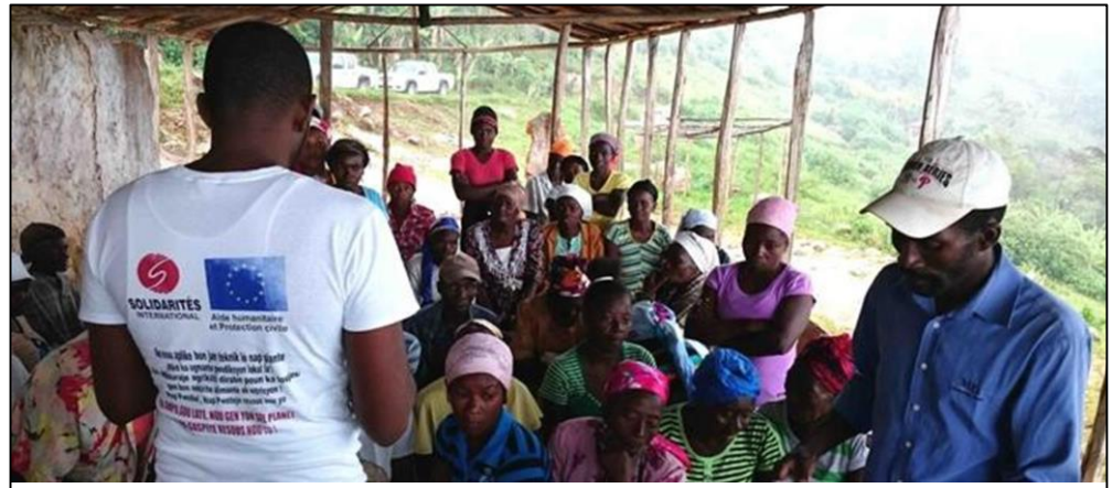
Sesión de información de distribución de vales en el contexto de la ayuda alimentaria de la Comisión Europea. Intervención de respuesta a la sequía en el departamento Sudeste, Haití.

*Todas las fichas informativas más recientes de ECHO: