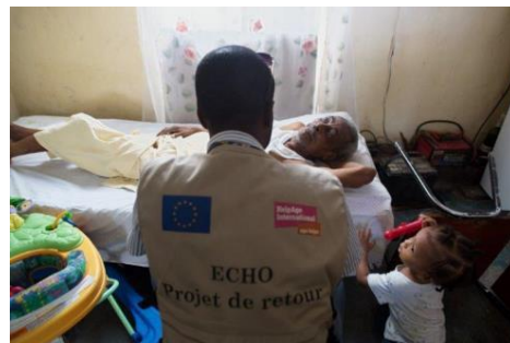
Un hombre mayor se beneficia del programa de ayuda al alquiler para dejar el campamento.

El catastrófico terremoto de magnitud 7.0, que asoló el país en 2010, desencadenó una respuesta humanitaria masiva. En la fase de emergencia, la financiación de la UE ayudó a proporcionar refugio, agua potable, asistencia sanitaria, alimentos, protección y artículos de primera necesidad a cerca de 5 millones de personas . Se establecieron hospitales móviles mientras se rehabilitaban las instalaciones sanitarias que habían sido destruidas. Entre 2010 y 2016, la respuesta del departamento de Ayuda Humanitaria y Protección Civil de la Comisión Europea (ECHO) ha ayudado a un total de 1,3 millones de personas en los campamentos , facilitando el acceso a servicios de primera necesidad y a una infraestructura de asistencia sanitaria básica.