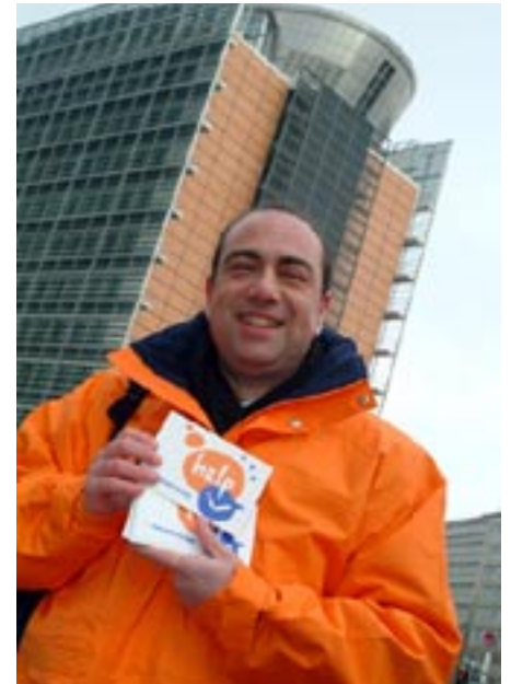
Kommissar Kyprianou beim Start der Kampagne in Brüssel

Vorabtests: In einer Vorabtest-Phase während der Produktion der TV-Spots gegen das Rauchen konnten an die 400 Personen aus 38 Zielgruppen in 20 EU-Ländern zum Rauchen befragt werden. Die Ergebnisse der Untersuchung sind in einer Datenbank gespeichert, die Aufschlüsse gibt über Verhaltensweisen