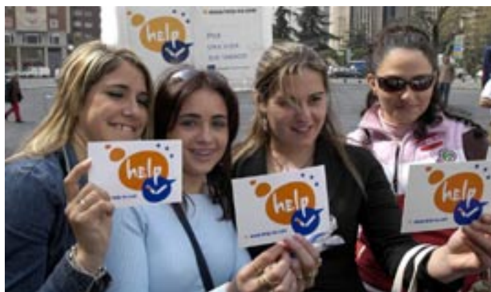
Start der HELP- Kampagne, Madrid

Ziel der Kampagne ist es, darauf aufmerk-