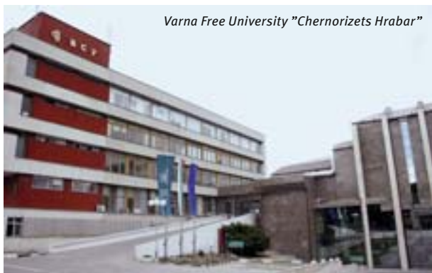
Varna Free University "Chernorizets Hrabar"