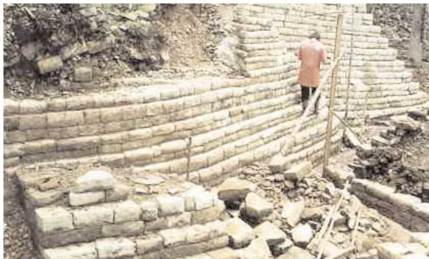
Lubaantún, côté Sud-est structure 104 avant (en haut), après (en bas)

Les archéologues le savent : les meilleures surprises arrivent souvent à la fin de la saison des