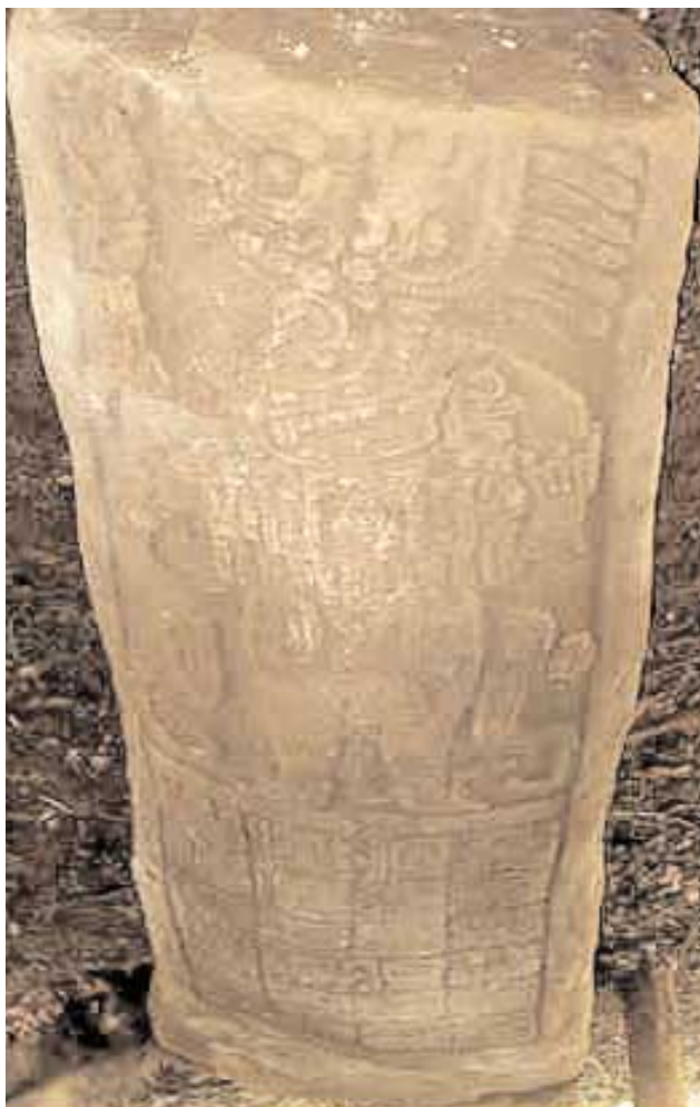
Nim Li Punit, Stèle 21