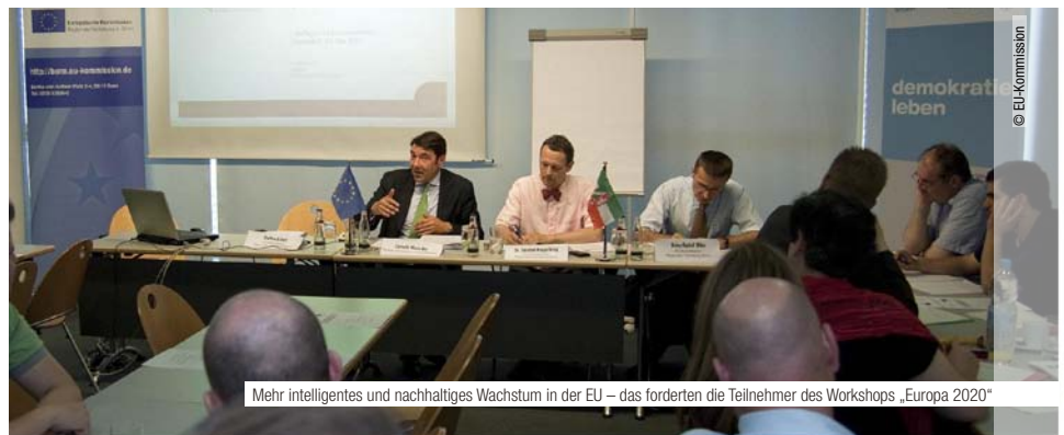
Mehr intelligentes und nachhaltiges Wachstum in der EU – das forderten die Teilnehmer des Workshops „Europa 2020“

Ziele durchaus auf regionale Anforderungen zugeschnitten sein können“, unterstrich Vis. Im Zusammenhang mit der Bewältigung der Finanz- und Wirtschaftskrise warnte er eindringlich da-