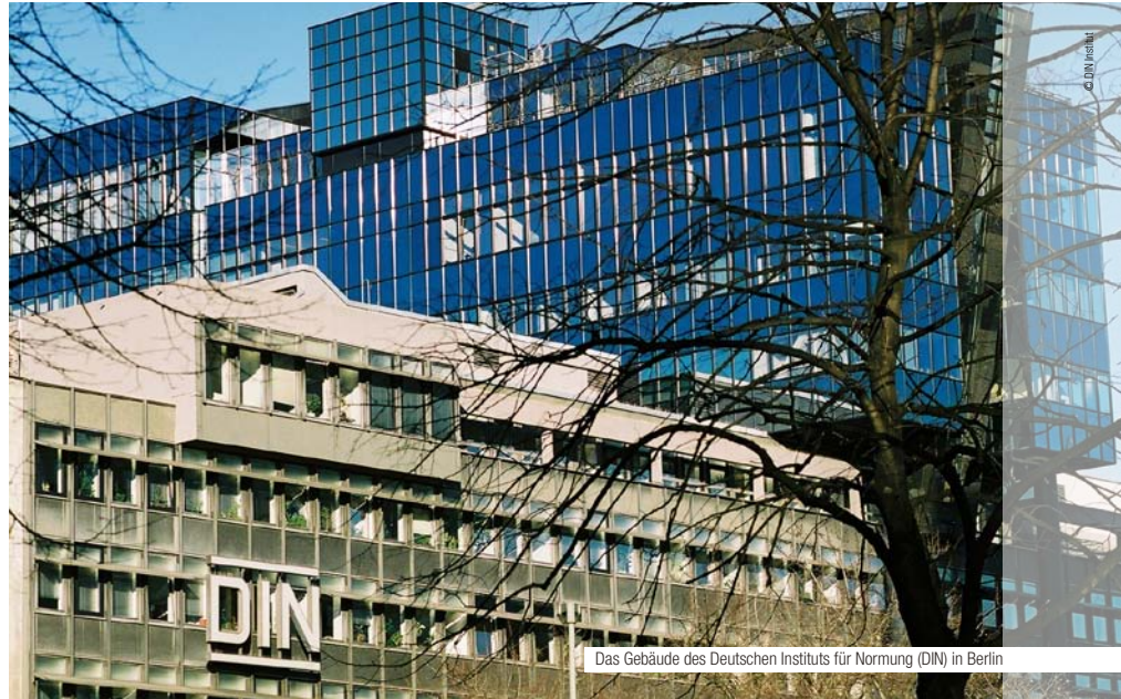
Das Gebäude des Deutschen Instituts für Normung (DIN) in Berlin

Als Paradebeispiel für eine sinnvolle EU-Norm gilt der neue Standard für ein