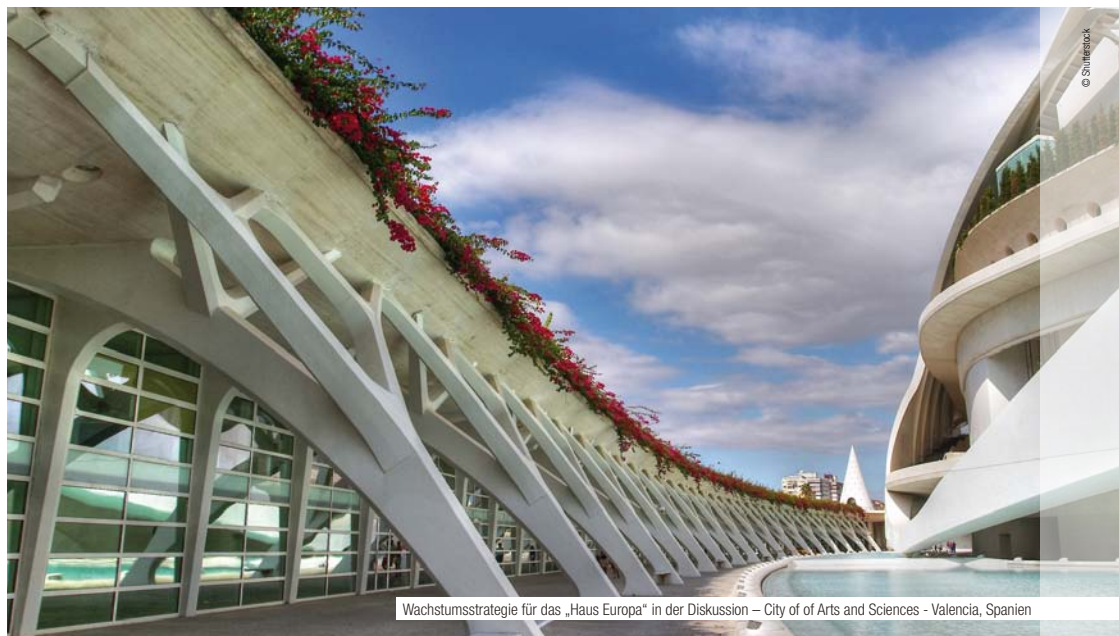
Wachstumsstrategie für das „Haus Europa“ in der Diskussion – City of Arts and Sciences - Valencia, Spanien

http://europa.eu/rapid/pressRelease-sAction.do?reference=SPEECH/11/422