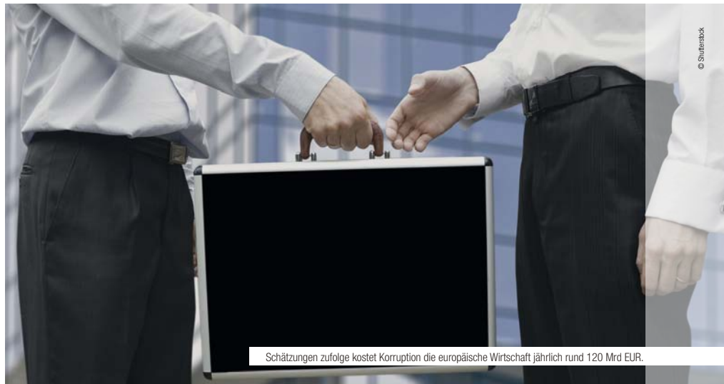
Schätzungen zufolge kostet Korruption die europäische Wirtschaft jährlich rund 120 Mrd EUR.

Parallel dazu werde die Kommission in allen EU-Politikbereichen verstärkt auf Bestechung achten, gab Malmström den Kurs der neuen Antikorruptionspolitik vor. Im Herbst will die Innenkommissarin Änderungen der EU-Regeln für die Beschlagnahme illegal erworbener Vermögenswerte vorschlagen sowie eine Verbesserung der strafrechtlichen Finanzermittlungen in den Mitgliedsländern. Überarbeitet werden sollen auch die EU-Vorschriften für das öffentliche Auftragswesen sowie für Bilanzierung und Abschlussprüfung. Eine Strategie zur Verhinderung von Betrug zulasten der Finanzinteressen der EU ist ebenfalls in Arbeit.