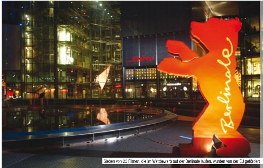
Sieben von 23 Filmen, die im Wettbewerb auf der Berlinale laufen, wurden von der EU gefördert

Im Rahmen der Berlinale werden mit der Förderung von MEDIA zudem zahlreiche Branchentreffs und Talentinitiativen organisiert. Über 100 Filmschaffende aus allen Bereichen treffen sich etwa beim „MEDIA-Umbrella“ auf dem European Film Market, um ihre Projekte zu prä-