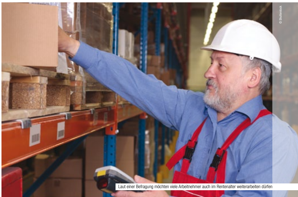
Laut einer Befragung möchten viele Arbeitnehmer auch im Rentenalter weiterarbeiten dürfen

Der jüngsten Eurobarometerumfrage zufolge meinen mehr als 60 Prozent der Befragten, man sollte auch nach dem Eintritt ins Rentenalter weiterarbeiten dürfen, und ein Drittel der Befragten erklärt, selbst gern länger arbeiten zu wollen. „Die Umfrage zeigt, dass die Menschen bereit sind, im Alter aktiv zu bleiben. Ich bin zuversichtlich, dass das Europäische Jahr als Katalysator wirken wird, um Entscheidungsträger zu mobilisieren, Aktivität im Alter zu fördern“, erklärte dazu der Kommissar für Beschäftigung, Soziales und Integration, Lázló Andor.