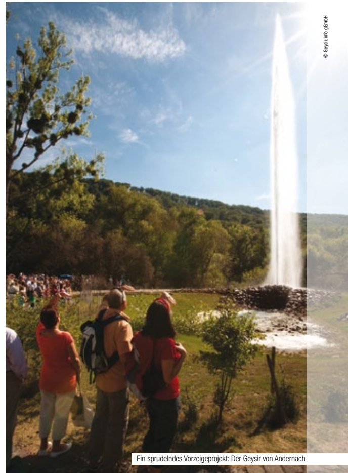
Ein sprudelndes Vorzeigeprojekt: Der Geysir von Andernach

Bielefeld in Nordrhein-Westfalen kommt gemeinsam mit acht anderen Städten und Regionen aus Nordwesteuropa in den Genuss einer finanziellen Unterstützung im Rahmen der Kohäsionspolitik. Das Ziel: die Lebensqualität durch einen nachhaltigen und umweltfreundlichen Verkehr zu verbessern. Das Projekt war auf drei Jahre angelegt, und das Hauptaugenmerk lag auf einem besseren öffentlichen Personennahverkehr. Besser hieß dabei, umweltfreundliche Verkehrsmittel zu fördern und die Verkehrsplanung zu vernetzen. Mit 15 Millionen Euro woll-