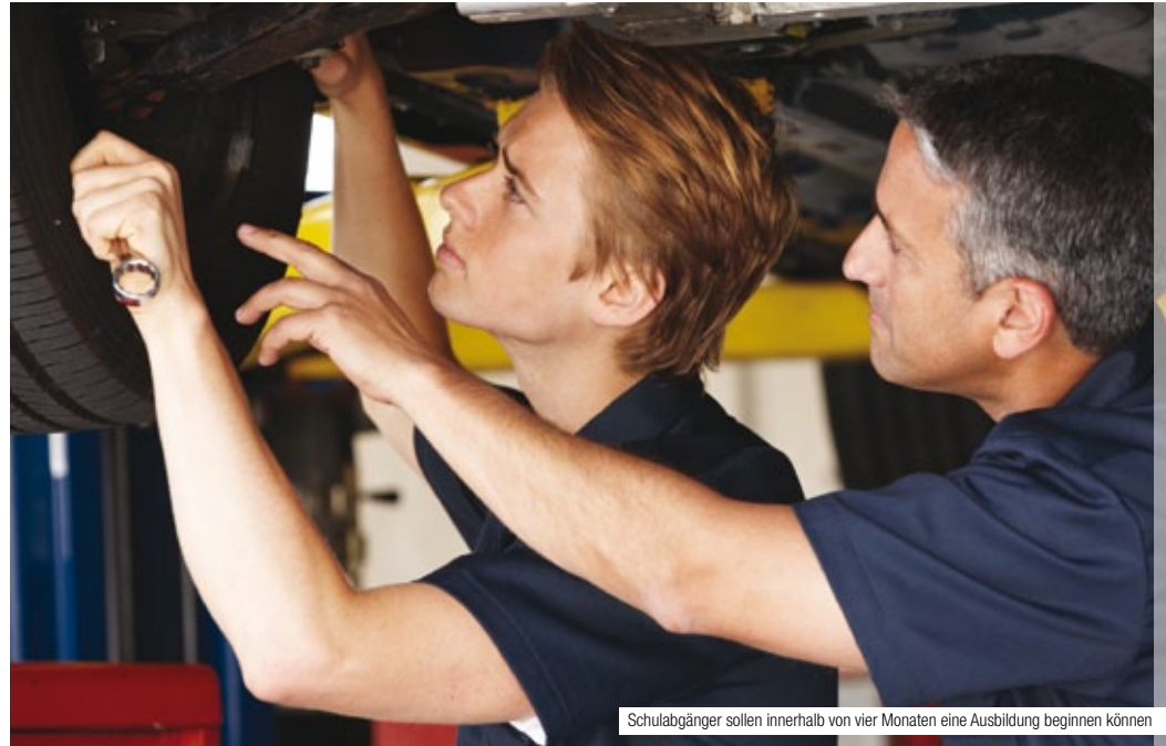
Schulabgänger sollen innerhalb von vier Monaten eine Ausbildung beginnen können

http://europa.eu/rapid/pressReleaseAction.do?reference=IP/12/94&format=HTML&aged=0&language=DE&guiLanguage=en