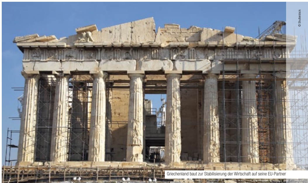
Griechenland baut zur Stabilisierung der Wirtschaft auf seine EU-Partner

http://europa.eu/rapid/pressReleaseAction.do?reference=MEMO/11/621&format=HTML&aged=0&language=EN&uiLanguage=en