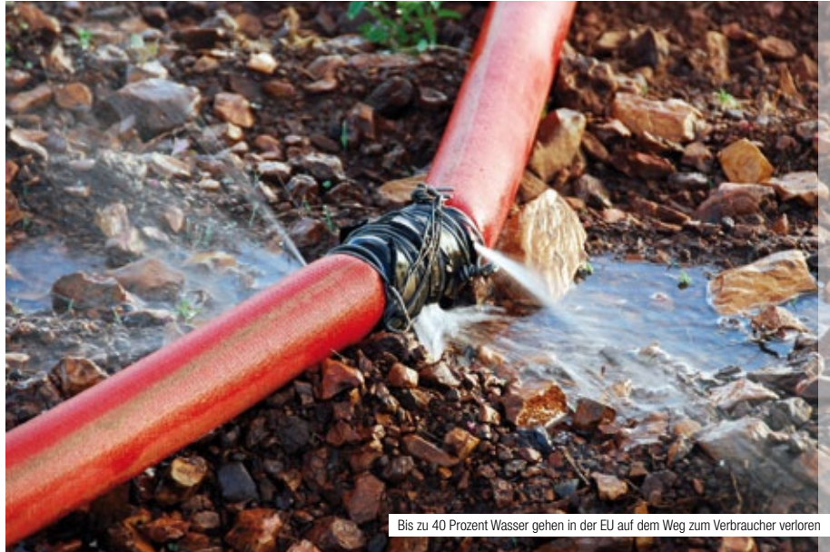
Bis zu 40 Prozent Wasser gehen in der EU auf dem Weg zum Verbraucher verloren

„Ökodesign“ von möglichst vielen Produkten und Ökolabel sollen die Verbraucher zu nachhaltigerem Konsumverhalten motivieren. Die öffentliche Hand soll bei der Vergabe von Aufträgen ressourcenschonende Produkte und Dienstleistungen besonders berücksichtigen. Beihilfen für umweltschädigende Industrieprodukte will die Kommission abschaffen. Die Besteuerung soll anstelle des Faktors Arbeit künftig stärker die Umweltfolgen berücksichtigen. Die Kommission empfiehlt auch, die Preise für die Ressourcen so anzupassen, dass sie die wahren Kosten ihres Verbrauchs widerspiegeln. Eine Verständigung der Mitgliedstaaten auf