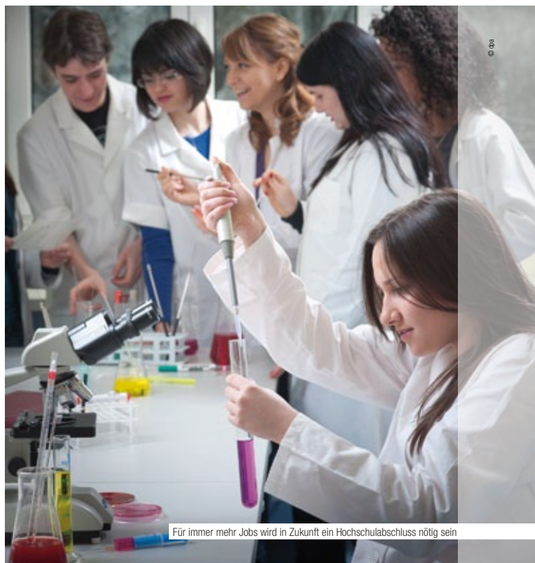
Für immer mehr Jobs wird in Zukunft ein Hochschulabschluss nötig sein

Zur besseren Finanzierung von Hochschulen und Austauschprogrammen hat die Kommission für die Jahre 2014 bis 2020 eine deutliche Erhöhung der EU-Budgets für allgemeine und berufliche Bildung (plus 73 Prozent) und Forschung (plus 46 Prozent) vorgeschlagen.