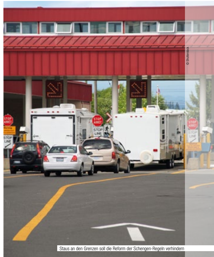
Staus an den Grenzen soll die Reform der Schengen-Regeln verhindern

die EU-Grenzschutzagentur Frontex) angeboten werden. Erst wenn das alles nichts nützt, sollen vorübergehend auch Kontrollen an Schengen-Binnengrenzen des betreffenden Landes möglich sein. Auch das aber nur mit EU-Erlaubnis. • Die Kommission will Teams zu unangekündigten Kontrollen schicken, um die korrekte Anwendung aller Schengen-Regeln zu prüfen.