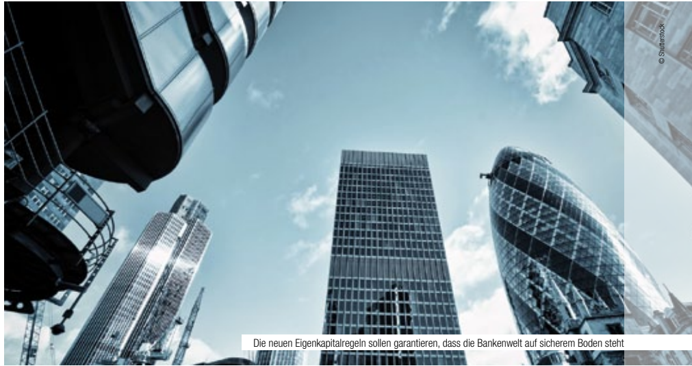
Die neuen Eigenkapitalregeln sollen garantieren, dass die Bankenwelt auf sicherem Boden steht

Das vorgeschlagene Regelwerk ist finanztechnisch hochkompliziert, aber zwei Prinzipien sind einfach zu verstehen: Wer viel Geld verleiht, muss künftig über mehr eigenes Kapital verfügen, um Zahlungsausfälle besser verkraften zu können; und wer Kredite vergibt, muss sich selbst ein Bild von der Solidität des damit finanzierten Projekts machen und darf sich nicht fast automatisch auf fremde Einschätzungen, etwa durch Ratingagenturen, verlassen. Diese Vorsichtsmaßnahmen sollen laut EU-Binnenmarktkommission