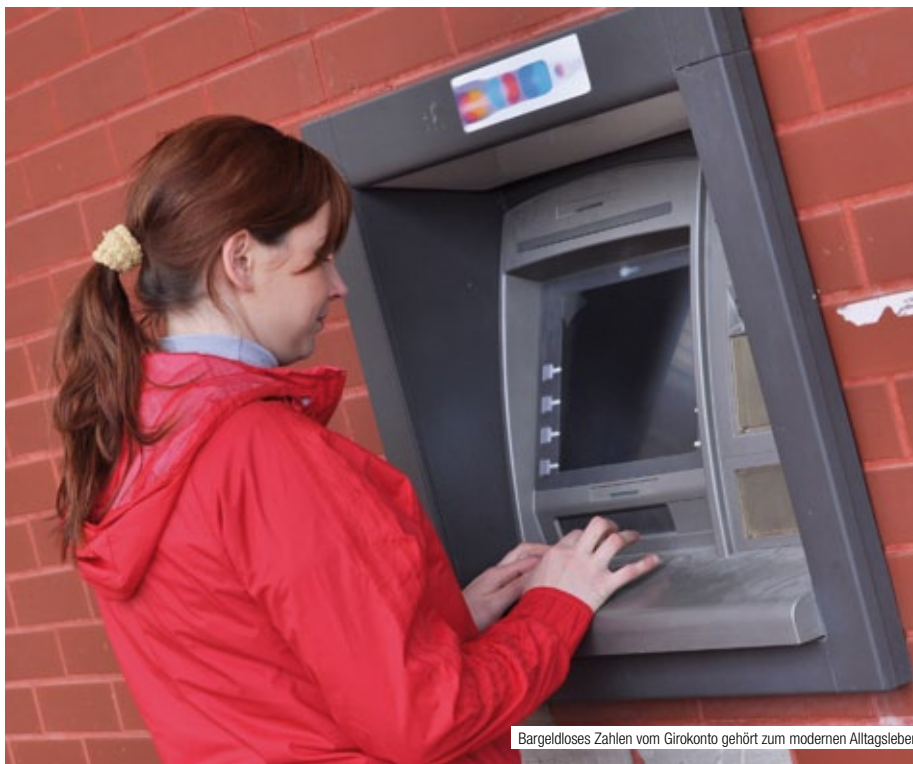
Bargeldloses Zahlen vom Girokonto gehört zum modernen Alltagsleben

Laut Verbraucherzentrale Bundesverband ist in Deutschland die Zahl der Kontenkündigungen durch die zwischenzeitliche Einrichtung eines sogenannten P-Kontos mit automatischem Pfändungsschutz zwar zurückgegangen. Allerdings seien die Gebühren für solche Konten sehr hoch und die Leistungen sehr niedrig – weder seien Lastschriften möglich noch erhalte der Kontobesitzer eine Zahlungskarte.