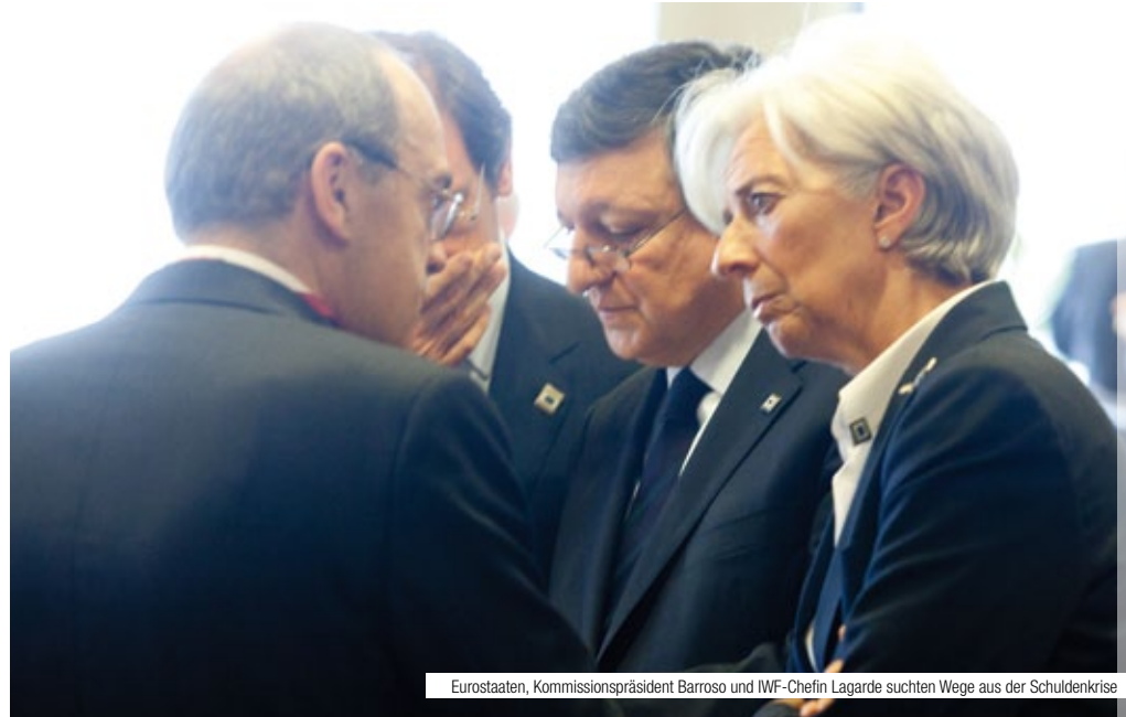
Eurostaaten, Kommissionspräsident Barroso und IWF-Chefin Lagarde suchten Wege aus der Schuldenkrise

http://europa.eu/rapid/pressRelease-sAction.do?reference=MEMO/11/518&format=HTML&aged=0&language=en&uiLanguage=en