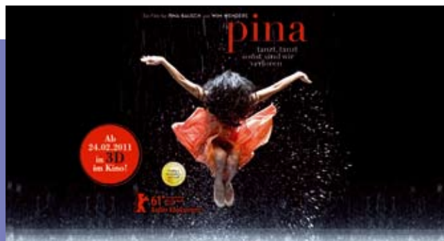
MEDIA-geförderte Filme auf der Berlinale: „Mein bester Feind“ und „Pina“